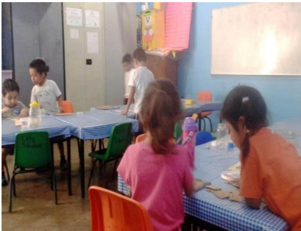
Grupo 2° "B"