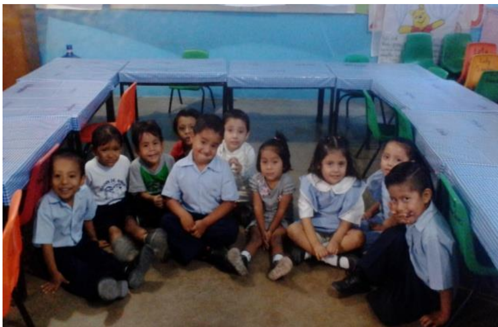
Alumnos del Grupo 2° "B"