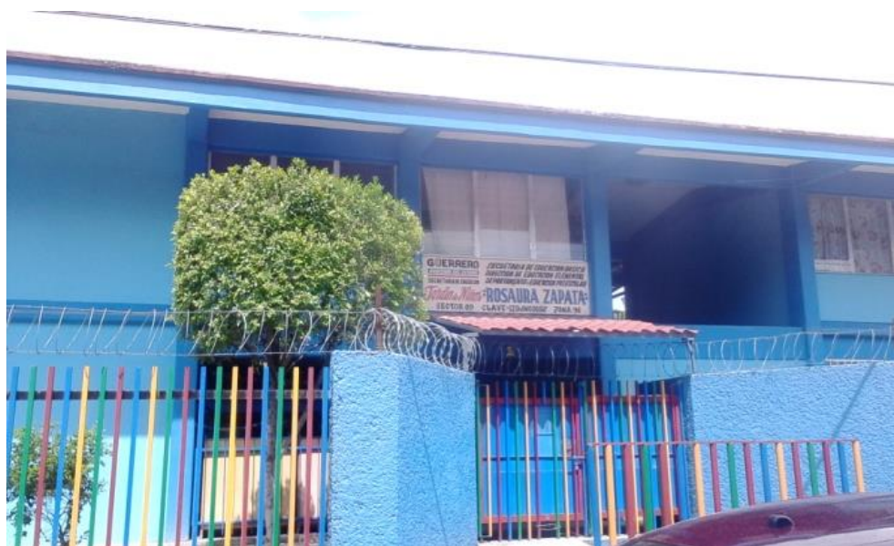
Fachada del jardín