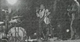
1. Café Tacvba