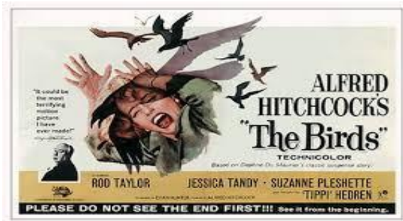
Imagen 1. 7