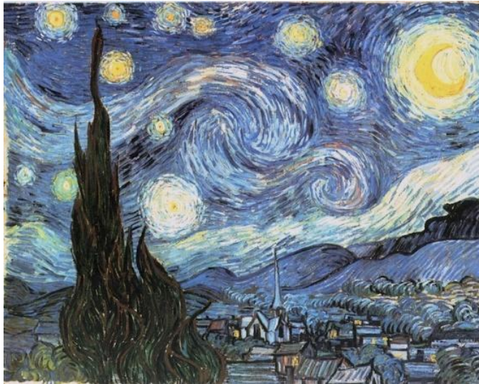
Imagen 3. 20