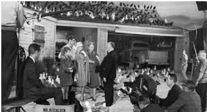
Imagen 2. 8

Puede verse que la sincronización audiovisual no es únicamente un proceso de tecnología, máquinas y tecnicismos. Por el contrario, es uno de los elementos que da vida a la película y, por ende, el considerando el presente tema de investigación,