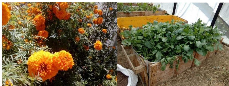
Figura 4. Ejemplo de productos cultivados: cempasúchil y acelgas.

Por otra parte, en cuanto al esquema productivo, los productos que se siembran son las fresas, acelgas, zanahoria, lechuga, jitomate, cilantro, papa, maíz, calabaza, chile, betabel, rábano y cempasúchil, algunos ejemplos de dichos productos se pueden apreciar en la Figura 4 .