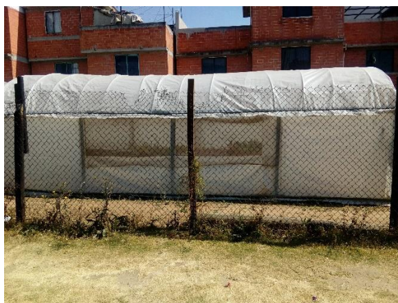
Figura 3. Organización para la producción agroalimentaria urbana.

Iniciando operaciones en el año 2013 y gracias a la iniciativa de alumnas de las carreras de Ingeniería Agrícola y Administración de la Facultad de Estudios Superiores Cuautitlán campo 4 y al apoyo de alumnos del servicio social, provenientes de la misma institución y la ayuda colectiva de los habitantes de la Colonia 6 de Octubre , se desarrolla una organización para la producción agroalimentaria urbana Figura 3 .