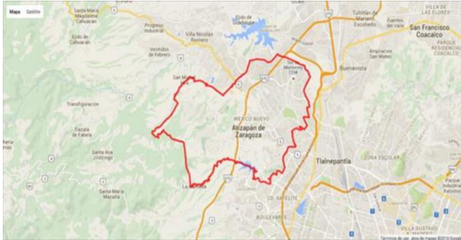
Figura 2. Atizapán de Zaragoza, Mexico Instituto Nacional de Estadística Geografía e Información

La Colonia 6 de Octubre , con ubicación en el municipio de Atizapán de Zaragoza, Estado de México, es resultado del esfuerzo realizado entre el bloque de organizaciones sociales, que teniendo como base una ideología de organizaciones, en la que las personas puedan participar creando cosas de valor colectivamente, se propone la creación de