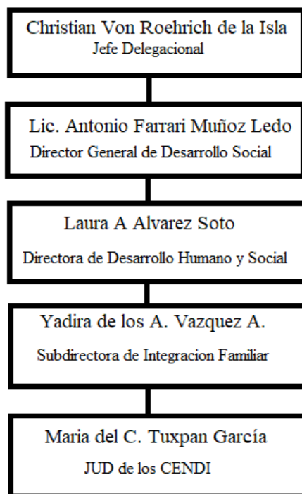
FIGURA C. Autoridades de la Delegación Benito Juárez