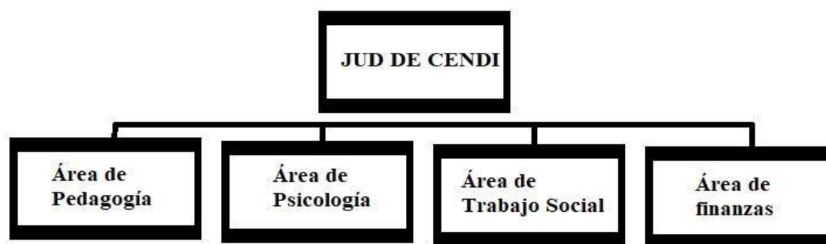
FIGURA B. Organigrama interno de los CENDI en Benito Juárez