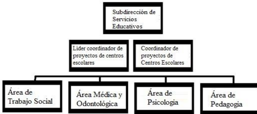
FIGURA D. Organigrama interno de los CENDI en Miguel Hidalgo