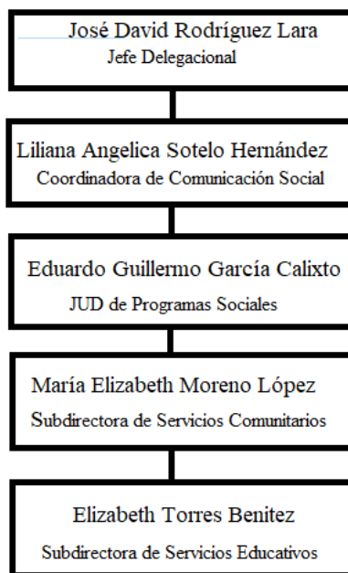
FIGURA E. Autoridades de la Delegación Miguel Hidalgo