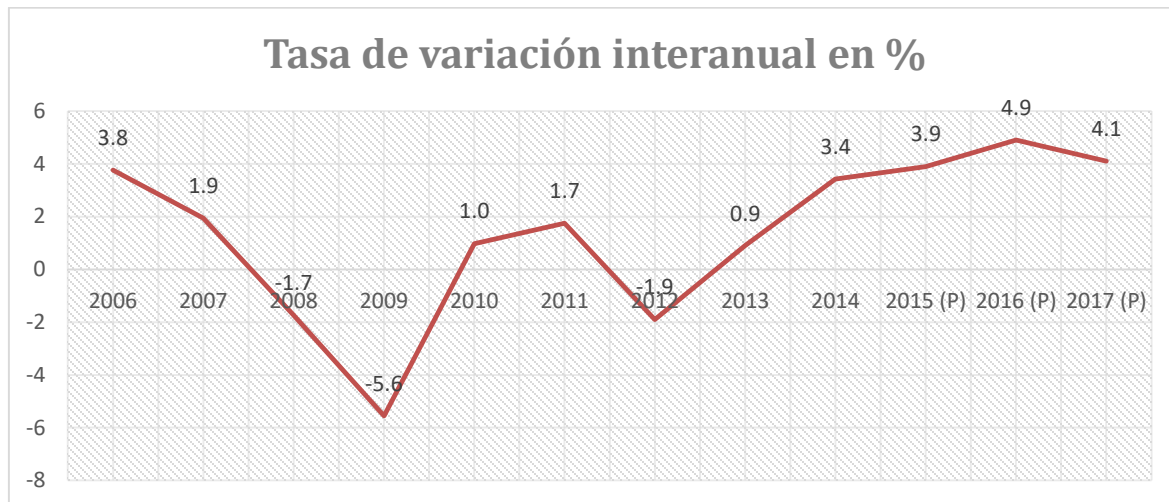
Tabla 2. Indicador Sintético del Turismo en España (PIB Turístico) (ISTE) 43

Fuente: Exceltur, Índice Sintético del PIB Turístico Español (ISTE). [en línea], Dirección URL: http://www.exceltur.org/conozca-exceltur/que-es-exceltur/ [consulta: 2 diciembre 2017].