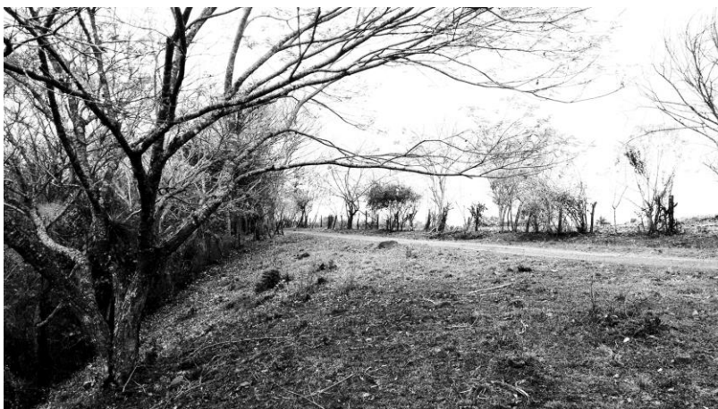
Figura 5. Camino de cornisa, que conduce a la casa de la familia.

terracería (véase figura 6), para llegar a la casa de ellas. En algún momento del recorrido es posible observar una de las dos barrancas sobre las que se encuentra su terreno, las cuales, sin necesidad de acercarse demasiado, es posible apreciar su interminable caída.