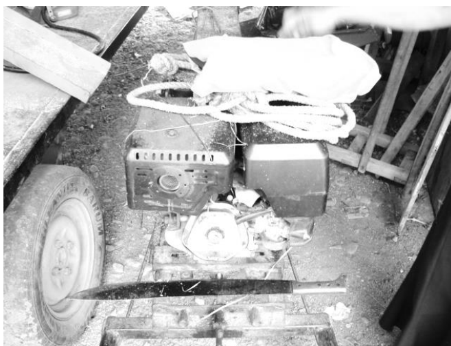
Figura 9. Picadora. Máquina utilizada en las labores del campo.

En tiempo de seca, su principal labor es darles de comer al ganado, lo alimentan con caña; van a donde está sembrada y la cortan, la llevan al potrero, que es el lugar donde están las vacas y ahí la comienzan a picar con una máquina, la cual tiene un motor muy pesado, lo que hace que sea difícil de transportar, además solo cuenta con una llanta en la parte de enfrente, lo que la hace inestable cuando se levanta del piso; al trabajo anterior se le agrega tener que llevarles agua, ya que los jagüeyes están secos, la obtienen del pozo o tienen que acarrearla desde el río, “temprano se van a cortar la caña, ...se llevan su picadora, su camioneta y a picar la caña y a echarles a las vacas y a sacar agua para las vacas y a cualquier cosa; pero las ven que trabajan ... Ese es el trabajo de casi toda la seca, alimentar el ganado, ...esa caña, tienen que cortar una buena porción que es la que, durante la tarde, le van a moler” ; no pueden ‘arreglar’ la caña para el ganado desde un día antes, ya que amanece agria.