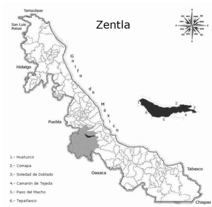
Figura 2. Mapa de Zentla, Veracruz. Extraído de «Sistema de información municipal. Cuadernillos municipales», de Subsecretaría de planeación, 2016.

Partiendo de Huatusco y conduciendo alrededor de media hora, 16.6 Km (Google Mapas, 2017), nos encontramos con el municipio de Zentla, (lugar donde se realizó el presente estudio) un lugar que a principios del siglo XVI quedó despoblado de indígenas; y en su lugar, un grupo de misioneros crearon un pequeño pueblo, hoy en día localidad de Zentla y que fungiera como primera cabecera municipal.