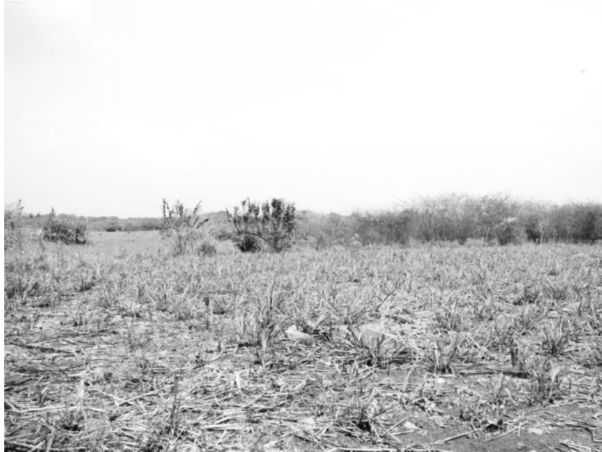
Figura 8. En esta fotografía es posible apreciar el terreno que se le dedica a la siembra de la caña.

Su horario de trabajo en el campo es mientras haya sol, comienzan a las cinco de la mañana y hay veces que hasta las ocho de la noche se les ve trabajando; una de sus principales ocupaciones es el cuidar el ganado, cuentan que estén todas, que ninguna este herida por algún animal, que no se vayan a pelear, si hay alguna que esta por parir, ellas son las que ayudan para que nazca bien el becerro, “luego hay casos que está una vaca y no puede parir, entonces tienen que meterle la mano... y son mis hermanas (las que) vigilan, palpan que la cabeza, las patitas vengan bien; ha habido ocasiones de que palpan y se dan cuenta de que viene torcido el animalito. Si viene bien, pues ellas jalan y ya es momento de que salgan y están luchando las vacas, pero las ayudan.