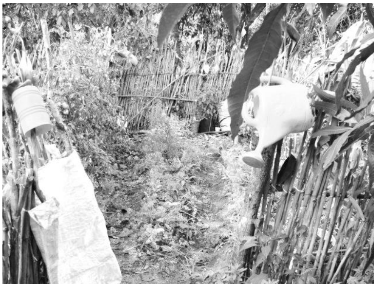
Figura 10. En esta fotografía se puede observar el invernadero, en él se siembra principalmente jitomate, chile y otros productos.

Otra actividad que es parte de las labores del campo es la siembra y cosecha del maíz, frijol, cacahuate, chile, jitomate, ajonjolí, entre otros productos ... “el cultivo que aquí que nosotros tenemos para sostenimiento es maíz y frijol, ya por ahí se va sembrando otra ayuda, que es, cacahuate, pipián y por ahí otra cosa que se va ahí uno ayudando” .