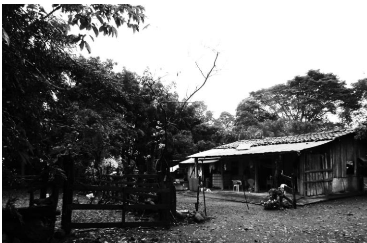
Figura 6. Casa de la familia, en la que es posible observar su estructura principalmente de madera, laminas, tejas y cemento.

La electricidad la obtienen de tres paneles solares, que le pidieron al gobierno municipal; es ocupada para hacer funcionar una licuadora para hacer la comida, una televisión y una grabadora en la que escuchan las noticias y un par de focos de baja intensidad, “Estuvimos vario tiempo sin luz y ahora que entró este presidente, ya le hicieron un pedido de una, dos, de... tres plantas, y si nos la dio; y ya ésta, gracias a Dios, ya nos