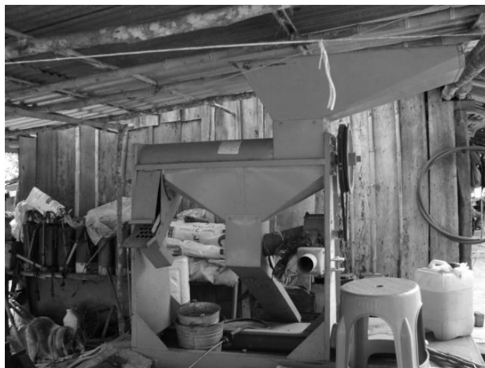
Figura 11. Máquina que se utiliza para desgranar el maíz; para su uso se requiere de la participación de al menos tres personas.

sembrar'; aquellos que siembran en agosto se arriesgan a quedarse sin cosecha, “una vez que se recoge el frijol del campo, ya que viene bien seco del campo, ya nada más es de quitarle la basura, de escogerlo y a guardarlo, para que no falte en la temporada en la que no hay cosecha... tenemos de dónde sacarlo porque ya lo embodegamos” .