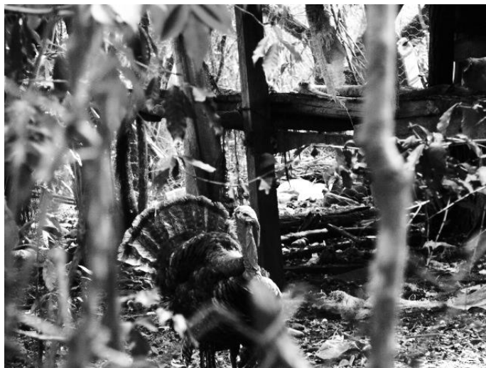
Figura 7. Guajolote, uno de los animales de corral con los que cuenta esta familia también, donde nos vamos ayudando ". La carne la consumen cuando llegan a vender una res, van y le compran al carnicero que se la vendieron.

gallina es también para la reproducción de huevo, es para que se reproduzca el huevo, el pollo y todo ello; ...a veces sí los vendemos, como por aquí la gente casi no tiene gallinas, no falta que: 'que quiero diez, que quiero veinte huevos, quiero los que tengan', de eso es