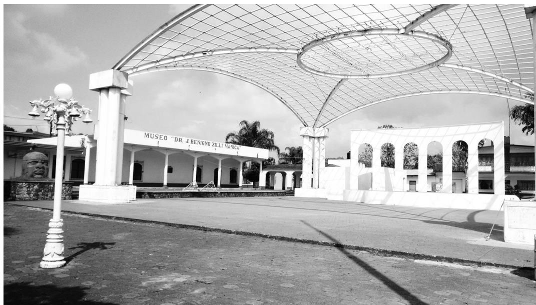
Figura 3. Plaza de la Colonia Manuel González.

En la plaza de la cabecera municipal (véase figura 3), se encuentran dos monumentos: el “León Veneciano de San Marcos” y una “Cabeza Olmeca”, que muestran las raíces culturales de la región. Uno de los elementos característicos, es la gastronomía; está compuesta por alimentos típicos mexicanos e italianos, principalmente la polenta, mortadela, longaniza, espaguetis, chicharrones, birria, mole, barbacoa, entre otros; de los cuales se sienten orgullosos (Municipio de Zentla, 2014).