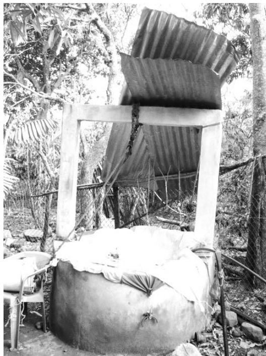
Figura 12. Pozo del que obtienen el agua, le colocan algunas mantas para evitar que se contamine.

El agua la obtienen de un pozo, mediante una bomba que es alimentada por un generador de luz, que funciona a base de gasolina; otra forma, es ir al rio para acarrearla, “el problema de la falta de agua, no tenemos para tirarla, si no, no costaba nada sacar el agua y tirarla para los árboles, el pozo que está destinado para las vacas está seco; ahí la llevamos poco a poco, van cuatro veces que se seca y luego le vuelve otra vez; hubo un tiempo que estuvo creo que dos años nada más seco y regreso” . El primer método, significa tener que destinar un significativo gasto económico en la gasolina, mientras que el segundo representa el tener que desplazarse hasta el rio a través de un terreno de difícil tránsito, lleno de plantas y ramas.