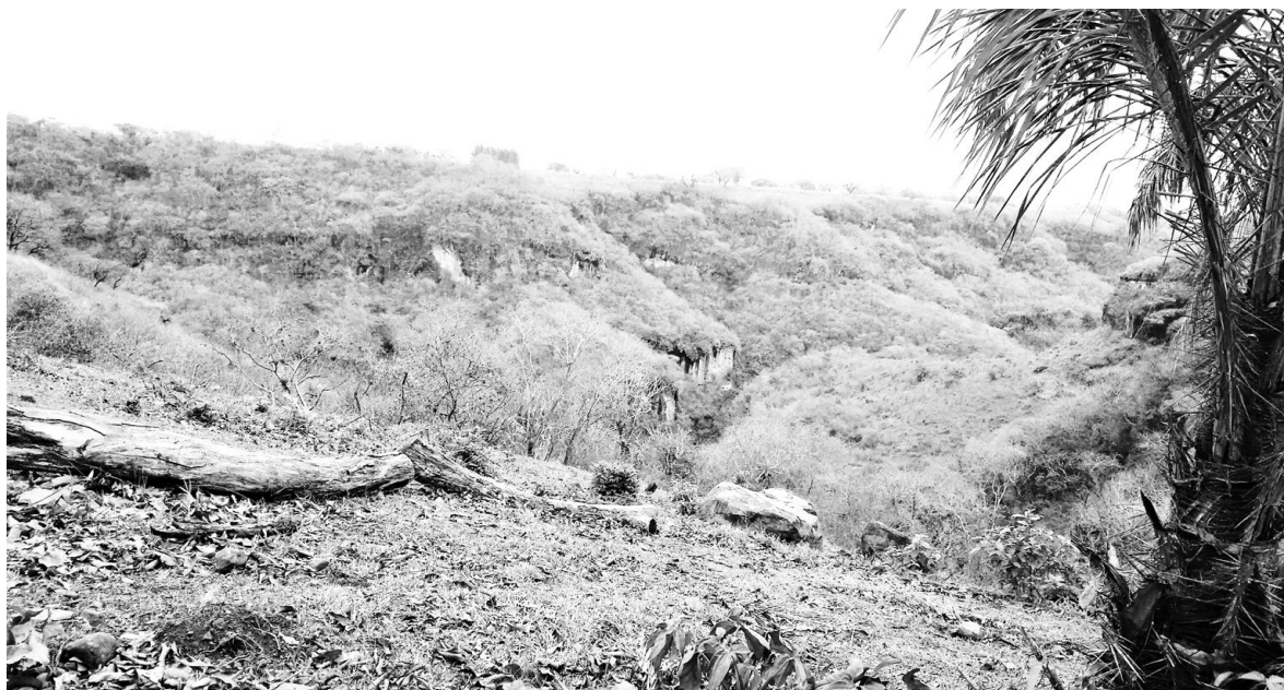
Figura 4. Barrancas del Municipio de Zentla.

En el municipio predominan los climas cálido subhúmedo y semicálido húmedo; con abundantes lluvias en verano. El uso del suelo está destinado principalmente a la agricultura 73%, el 23% a pastizal, 3% a selva y 1% a zona urbana, camino pavimentado que va de