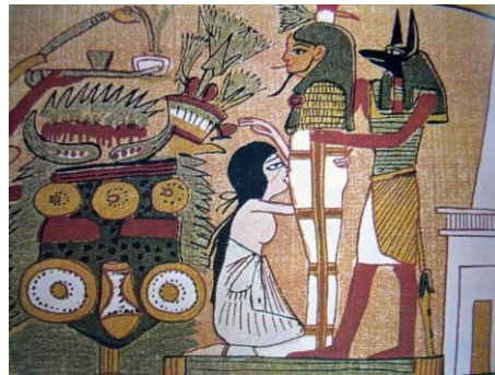
Imagen 2. Mural egipcio con representación de un cunnilingus