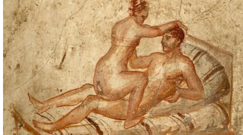
Imagen 1. Pintura erótica de un fresco pompeyano