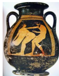
Imagen 3. Antigua vasija griega mostrando la copulación