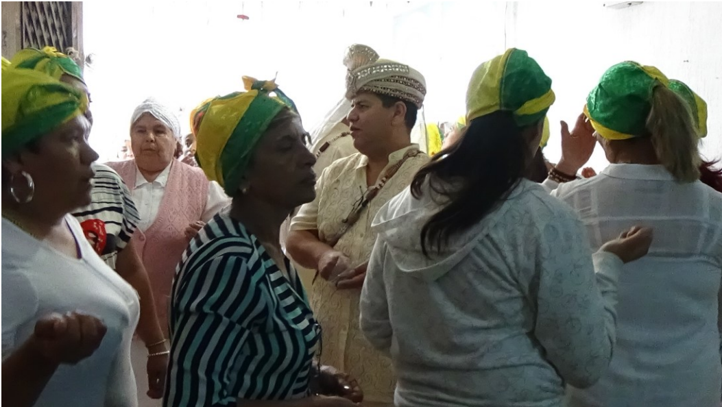
Imagen 16. Momento del baile que se hace durante el canto a Orula, en donde las mujeres danzan alrededor del Babalawo.