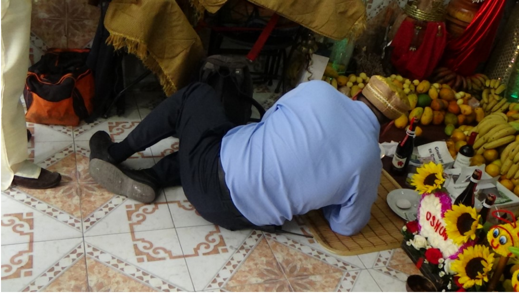
Imagen 15. Omolorisha haciendo foribale a Oshún.