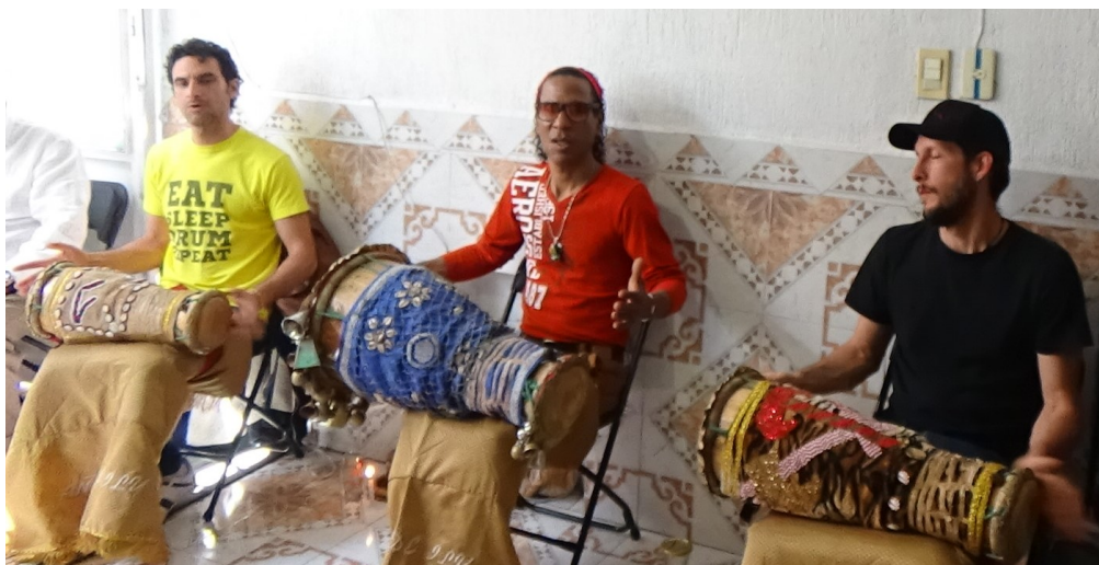
Imagen 3. Conjunto de tambores batá de tradición cubana. Foto tomada el 3 de marzo de 2017 en la Ciudad de México.