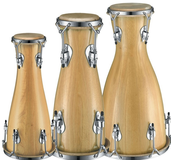
Imagen 4. Tambor batá avericolá.