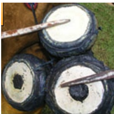
Imagen 2. Detalle del tambor omele meta .