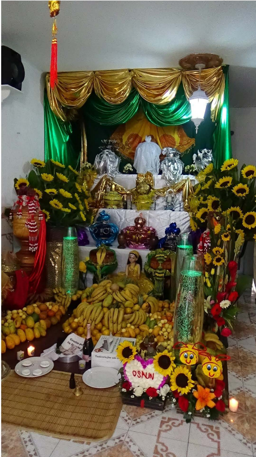
Imagen 13. Altar dedicado a Oshún en un domicilio particular o Casa-Templo .