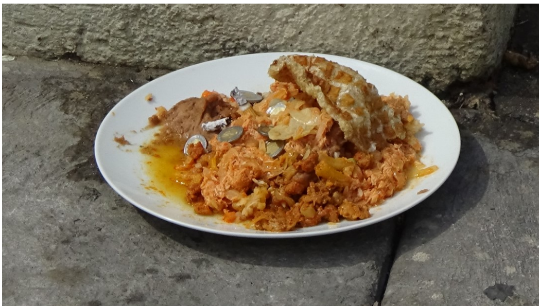
Imagen 17. Ofrenda para Eshu, a quien se le destinan las sobras de los alimentos de los músicos y babalawos, se le añade unas monedas. Los animales callejeros son ‘mensajeros’ de este orisha así que se espera que ellos den cuenta de la ofrenda.

*Imágenes 13 a 16 fueron tomada durante una ceremonia de Tambor dedicada a Oshún, el día 3 de marzo de 2017 en la delegación Gustavo A. Madero, Ciudad de México.