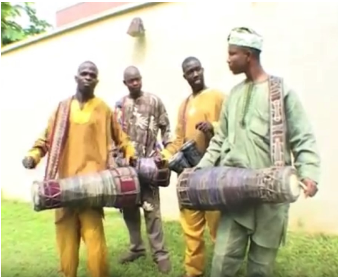
Imagen 1. Conjunto de tambor batak africano.