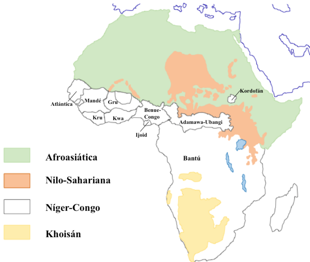
Mapa. 2. Distribución de las lenguas africanas con énfasis en la clasificación de Williamson y Blench (2000) de las lenguas Níger-Congo.

(Modificaciones en el diseño del mapa tomado de: Olson (2004) An evaluation of Niger-Congo classification p. 3).