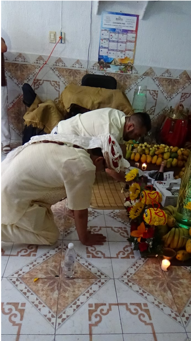
Imagen 14. Un babalawo y su ahijado haciendo foribale a un orisha masculino.