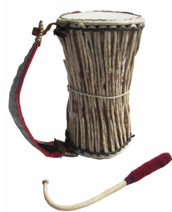
Imagen 5. Tambor parlante del conjunto dùndún africano (talking drum).