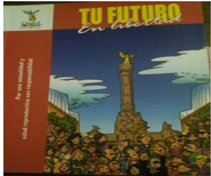
Figura 12. Libro “Tu futuro en libertad” 2008.

El libro recalca la importancia de la salud sexual de igual manera la prevención de embarazos.