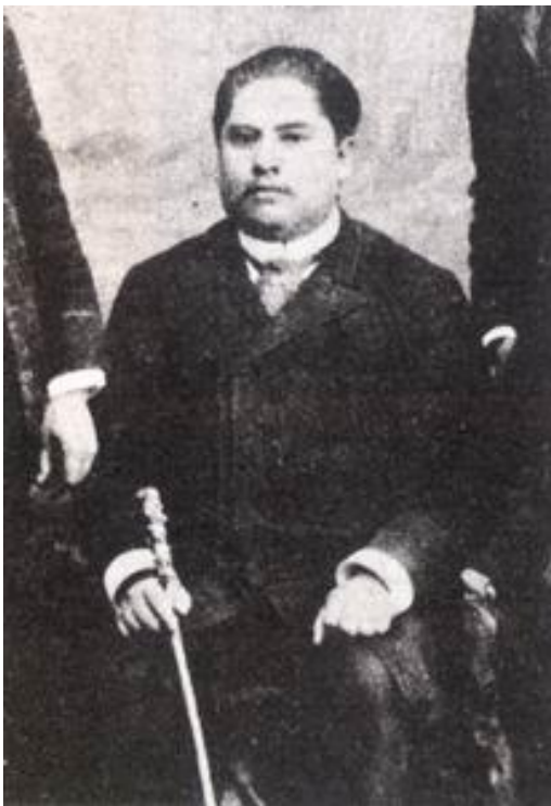
Felipe Villanueva en 1888.