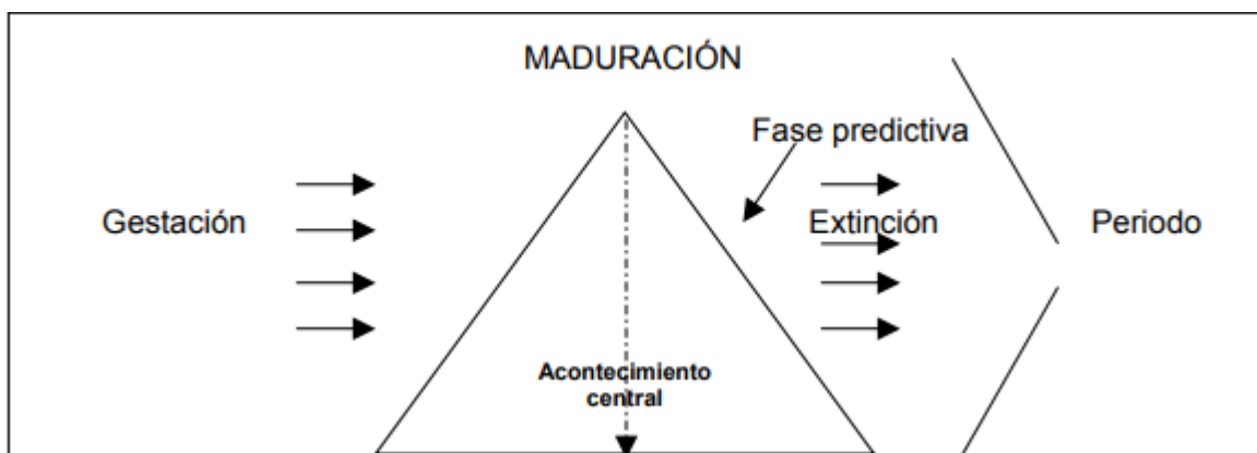
Tabla 5 Etapas de la coyuntura

Fuente: Sánchez Valdés, Néstor. « La coyuntura en el campo de objetos y los parámetros de tiempo. Una aproximación metodológica.» Revista Anthropos suplementos , 1994: Barcelona: 51.