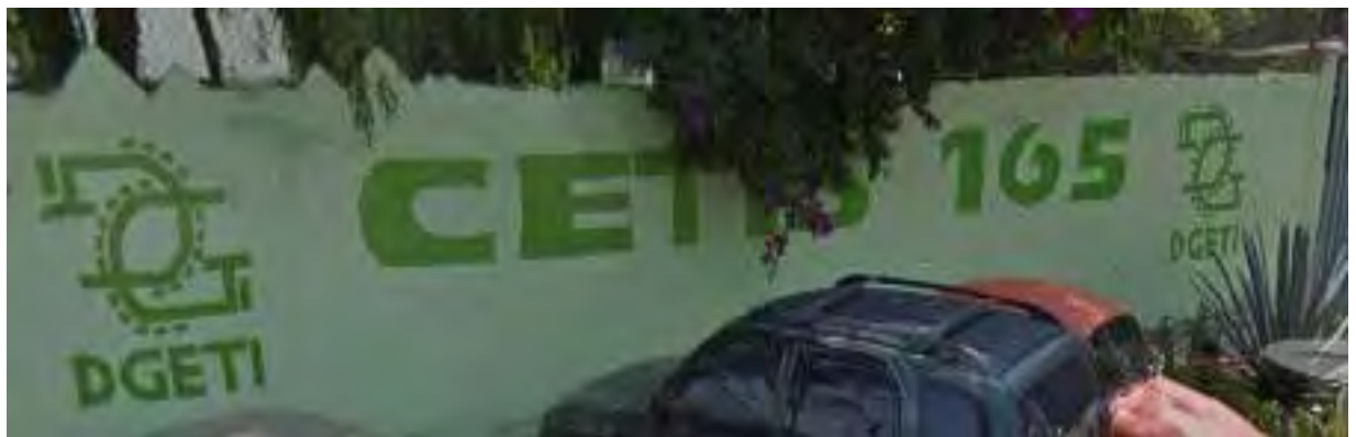
Figura 2. Fachada del CETIS 165