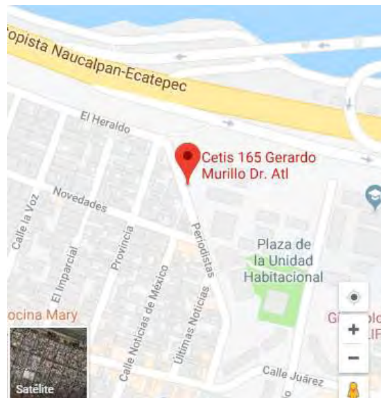
Figura 1. Croquis de la ubicación del CETIS 165.

El CETIS 165, “Gerardo Murillo Dr. Atl”, Estado de México tiene como dirección: Periodistas 190, Prensa Nacional, U.H. Ex Hacienda de Enmedio, 54170, Tlalnepantla, Méx.