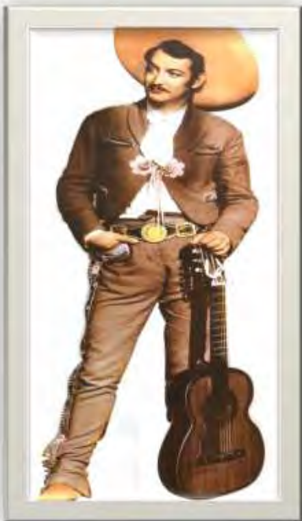
Jorge negrete. Actor y cantante.