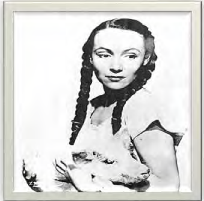
Dolores del Río, Actriz

Estas imágenes son un ejemplo de cómo era representada la mujer mexicana de los años 40 reflejadas por dos divas de esa época, María Félix, y Dolores del Río, fue así como se estereotipo la imagen en el mundo, con un silueta curvilínea, cadera grandes, cintura muy pequeña, con un bello rostro, pero con rasgos indígenas, de tez morenas claras, pelo largo muy negro, en ocasiones peinado con trenzas, o cabello suelto muy esponjado.