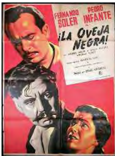
La oveja negra

Innumerables películas como El dolor de los hijos (1948), Eterna Mártir (1937), La familia Dressel (1935), Las mujeres mandan (1936), El dolor de los hijos (1948), Una familia de tantas (1937), Cuando los padres se quedan solos (1948), entre muchas otras, sin lugar a duda es uno de los géneros que ha sobrevivido en nuestros tiempos y que han marcado los estilos de familia que se transforman con el paso de los años, de los cambios de ideas y con nuevas problemáticas.