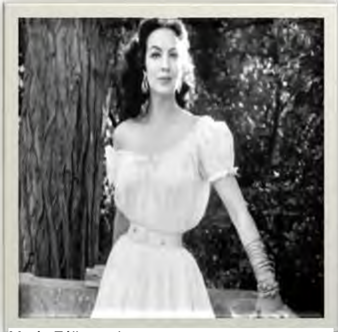
María Félix actriz