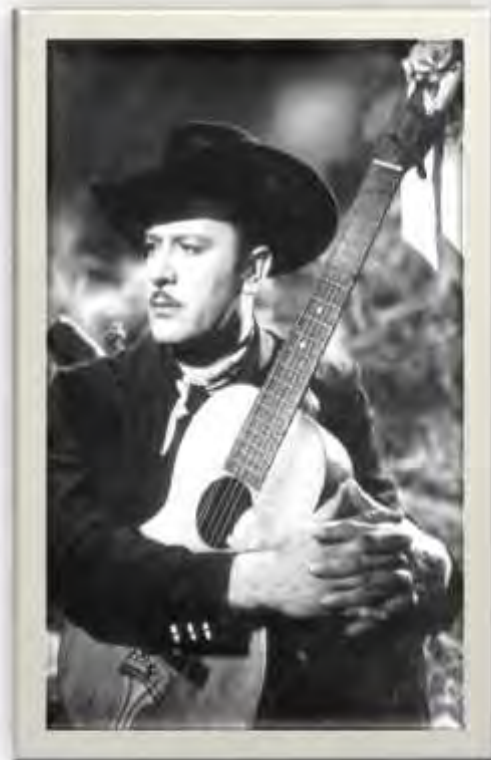
Pedro infante. Actor y cantante.

Los charros cantores, Pedro infante y Jorge negrete son un claro ejemplo de la imagen de mexicano, y como es representado ante el mundo, siempre vestidos de charros, con botas, sombreros, sus cinturones con hebillas grandes, y siempre acompañados de su guitarra.