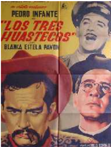
Los 3 huastecos

Nota: A partir de Los tres García, Infante y Rodríguez encadenarían un éxito tras otro en más de una docena de filmes inolvidables, Finalmente, en el terreno argumental, Los tres García significó la triunfal consolidación de la comedia ranchera, género netamente mexicano que se convirtió en la carta de presentación de nuestro cine en el extranjero a partir de Allá en el Rancho Grande (1936).