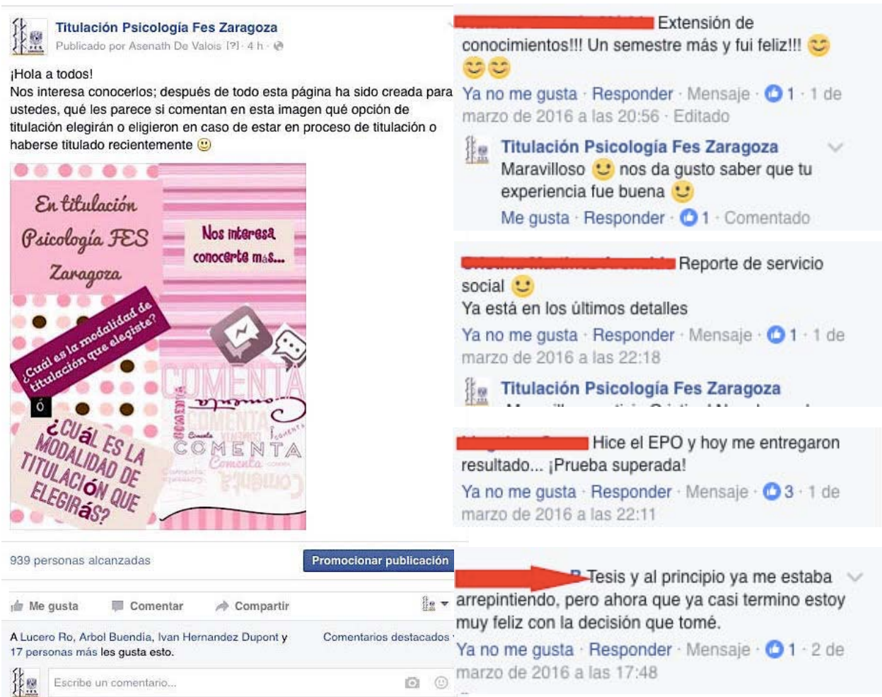
Figura 4. Algunos de los comentarios que se recibieron a la pregunta: ¿cuál es la modalidad de titulación que elegirás? Varios egresados comentaron sus experiencias con los tramites. Con estas dinámicas se pretende propiciar la participación de los seguidores de la página.