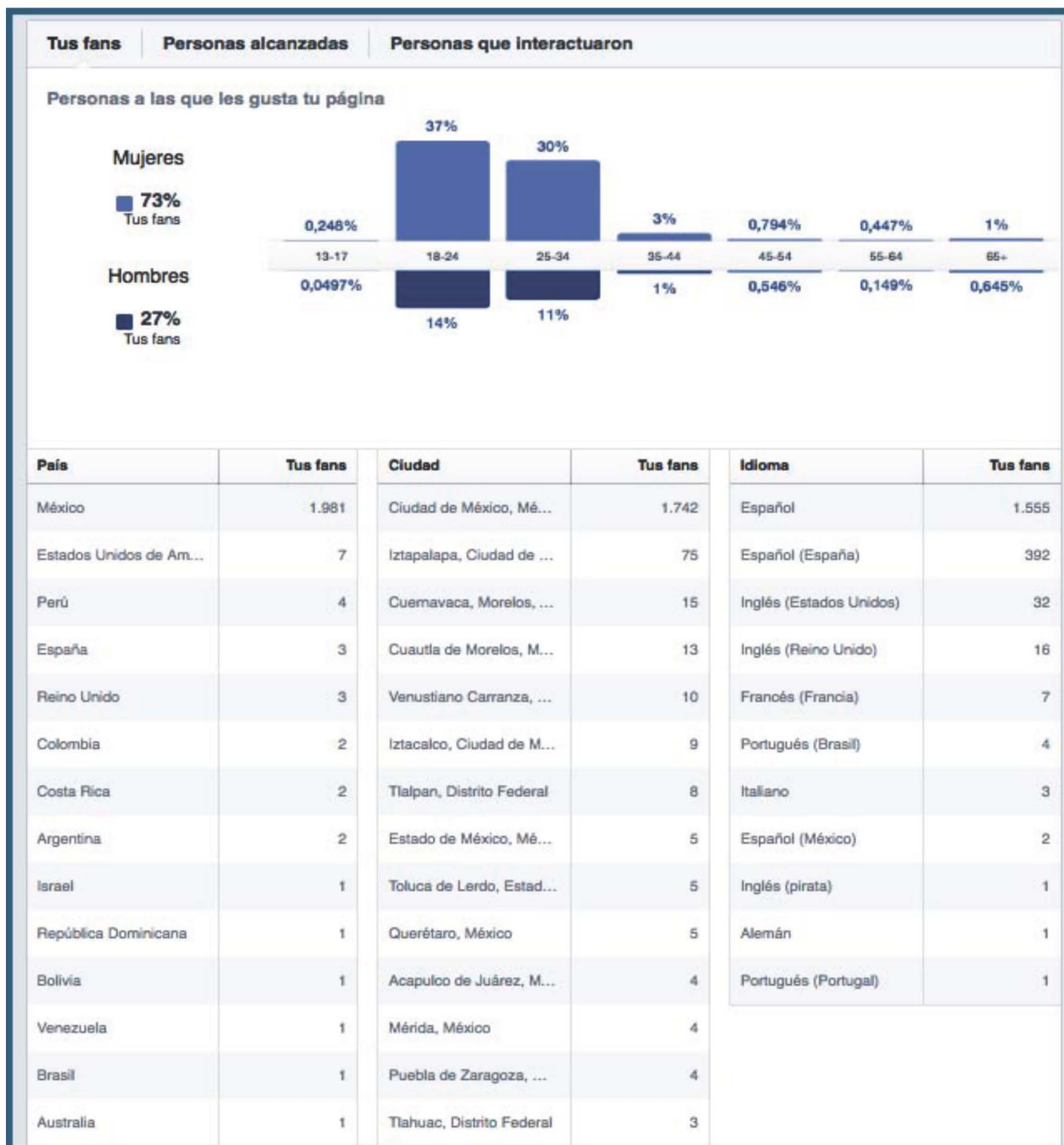
Figura 2. Distribución por edad y sexo de los seguidores de la página