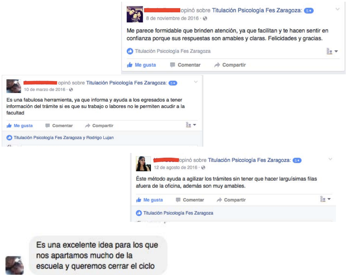
Figura 8. Algunas de las opiniones que los usuarios de la página han hecho de la atención recibida, así como alguno de los mensajes que se han recibido.