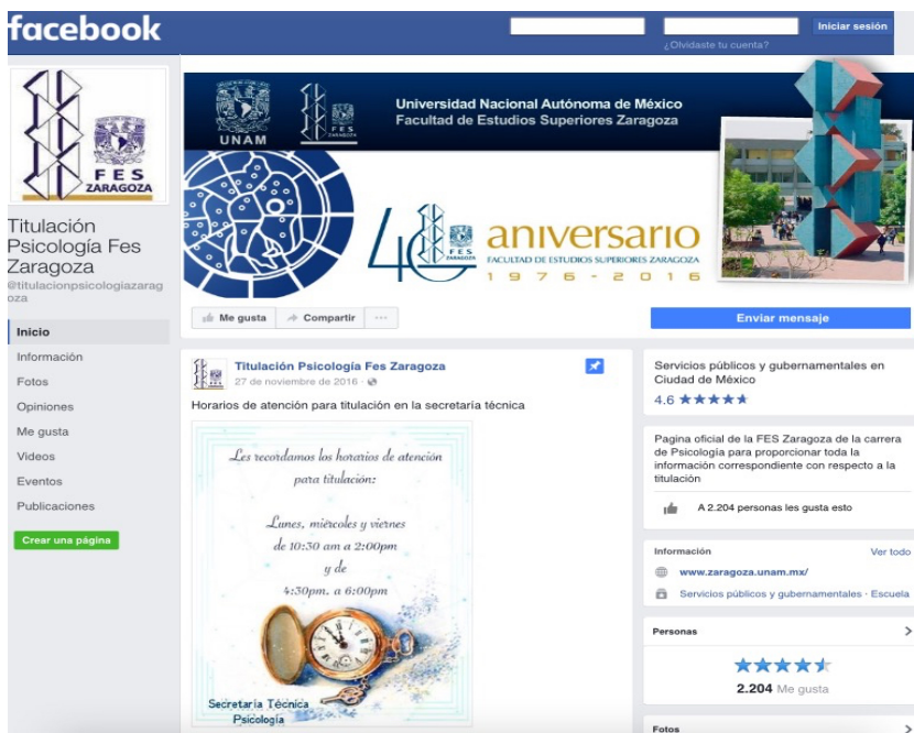
Figura 1. Impresión de pantalla de la página de Facebook

respuesta a las demandas de organizaciones internacionales, como la OCDE y reafirmando el compromiso que tiene la Universidad Nacional Autónoma de México, con los estudiantes al hacer más accesible la información del proceso de titulación, surge la propuesta de utilizar Facebook como una herramienta que acerca a los egresados con su titulación, de una manera sencilla, accesible y rápida. La creación de la página “Titulación Psicología FES Zaragoza” https://www.facebook.com/titulacionpsicologiazaragoza/ en junio de 2014 tenía como propósito enviar los formatos de registro lo que agilizaba el proceso, por una parte al recibir los ante proyectos de tesis en formato PDF y por otra permitió la creación de una base de datos con información de todos los proyectos registrados ante la secretaría técnica, que es la encargada del proceso de titulación. Aunque desde que se creó la página se tenía la idea de atender dudas, fue hasta inicios del 2016 que se logró dar un mayor impulso a este proyecto. En la figura 1 se puede ver una impresión de pantalla de la página.