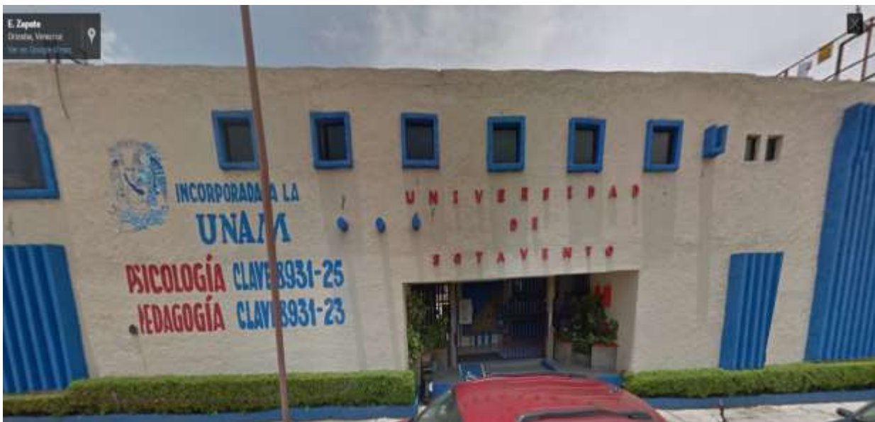
Fotografía 2: Vista frontal / entrada principal de la Universidad de Sotavento por Avenida Emiliano Zapata No. 75, en la Colonia El Espinal, Orizaba, Veracruz, C.P. 94330.