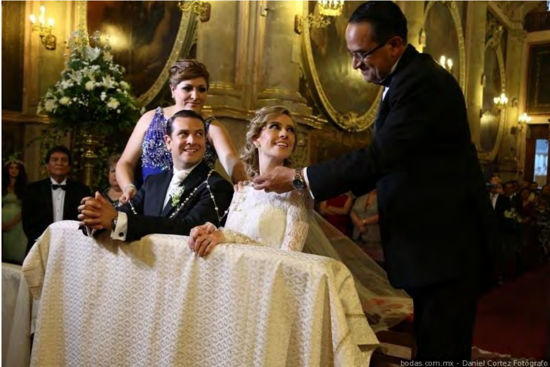
Imagen 1.4 Ceremonia de una boda del rito católico