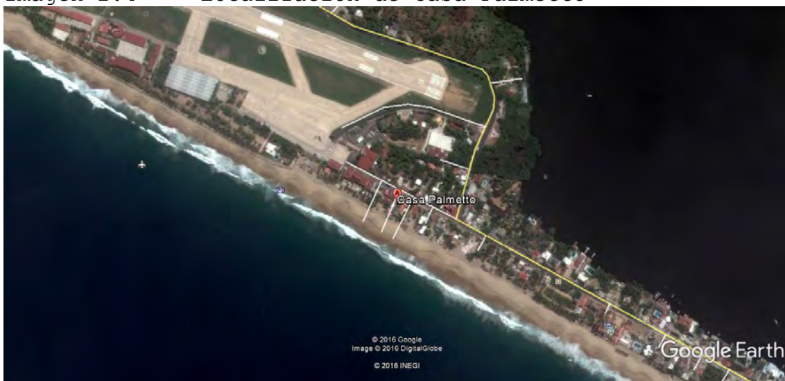
Imagen 2.4 Localización de Casa Palmetto