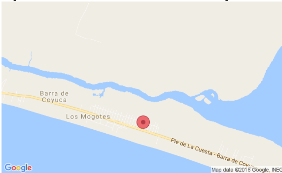
Mapa 2.3 Localización del Hotel Boutique del Mar