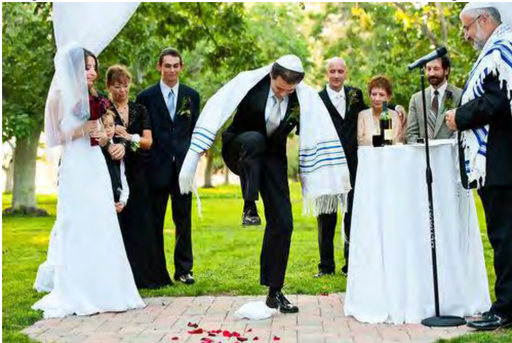
Imagen 1.3 Ceremonia de una boda del rito judío