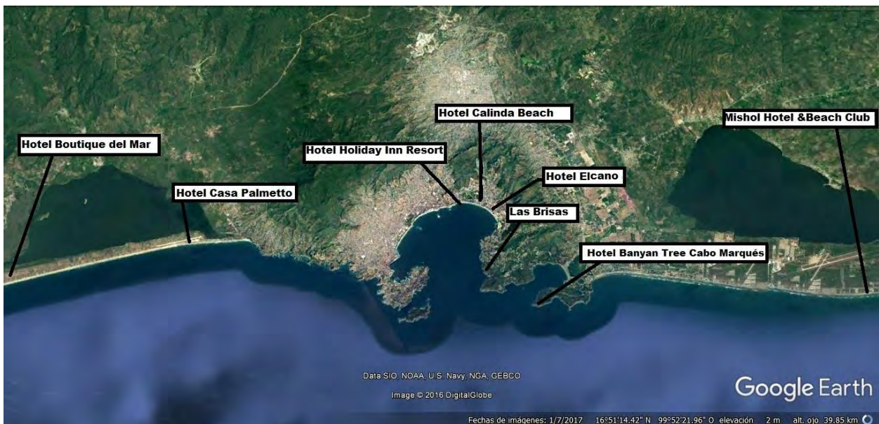
Imagen 2.2 Imagen de satélite de los hoteles trabajados.

Este subtema ofrece un panorama general de algunos hoteles, seleccionados, en Acapulco, en donde la oferta de bodas de playa es directa e incluso manifiesta de manera gráfica en las imágenes de promoción.