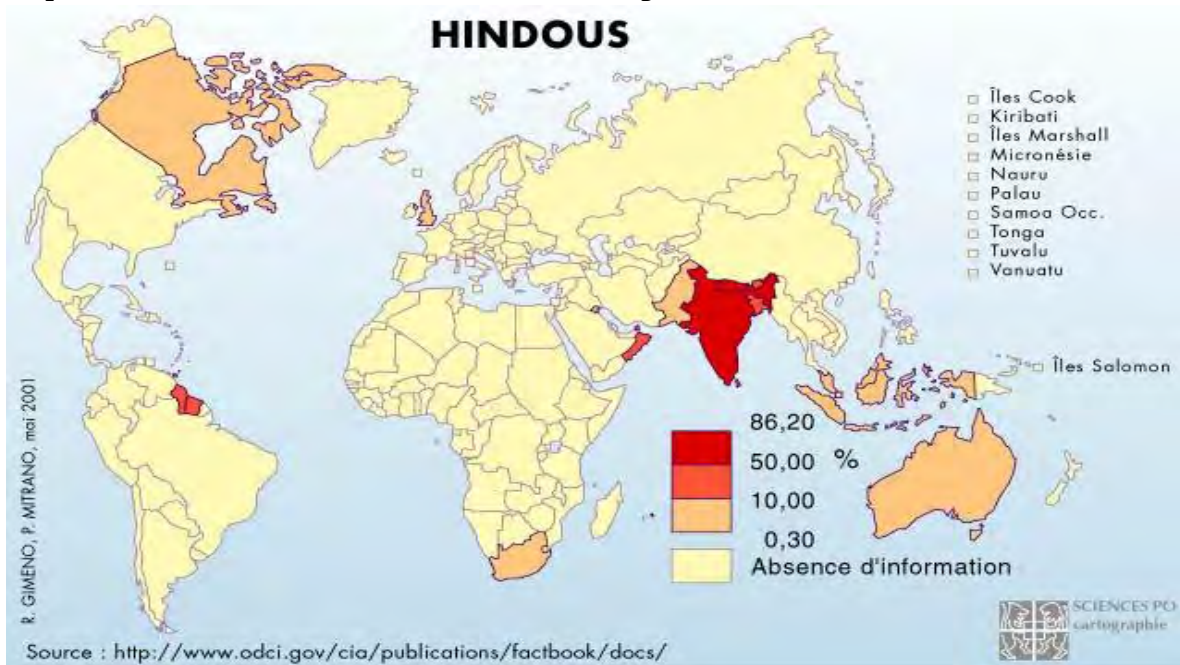
Mapa 1.2 Distribución de la religión Hindú