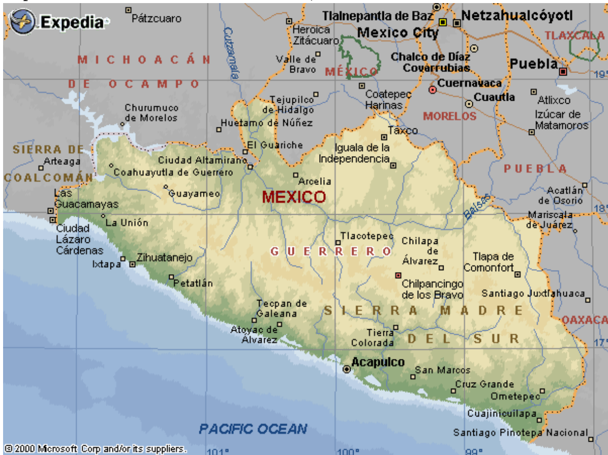
Mapa 2.2 El estado de Guerrero, características físicas

Fuente del mapa: http://www.mapas-de-mexico.com/guerrero.shtml