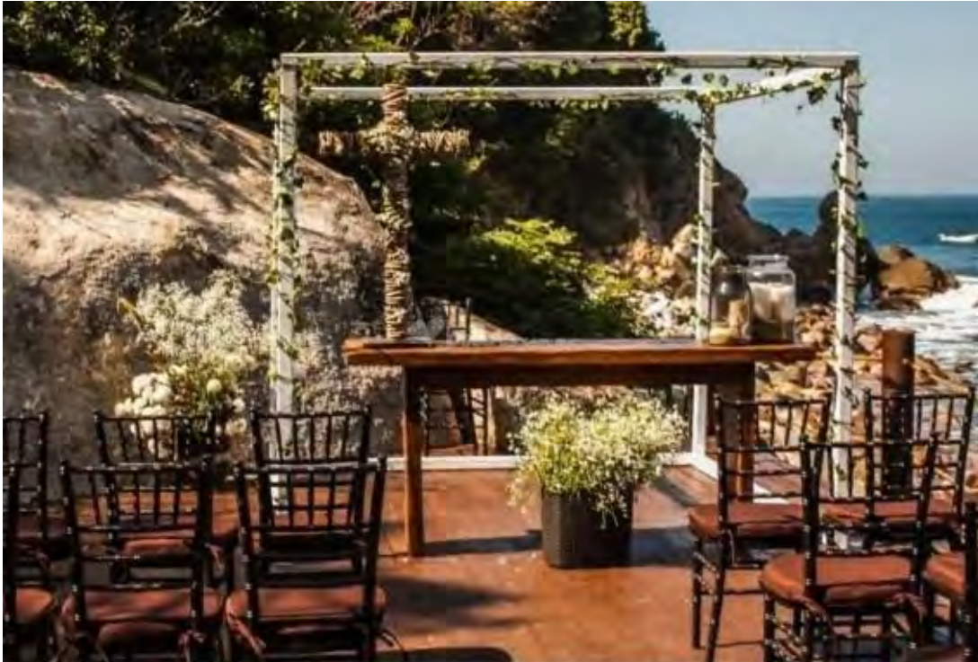
Imagen 2.8 Hotel Banyan Tree Cabo Marqués, montaje para la ceremonia