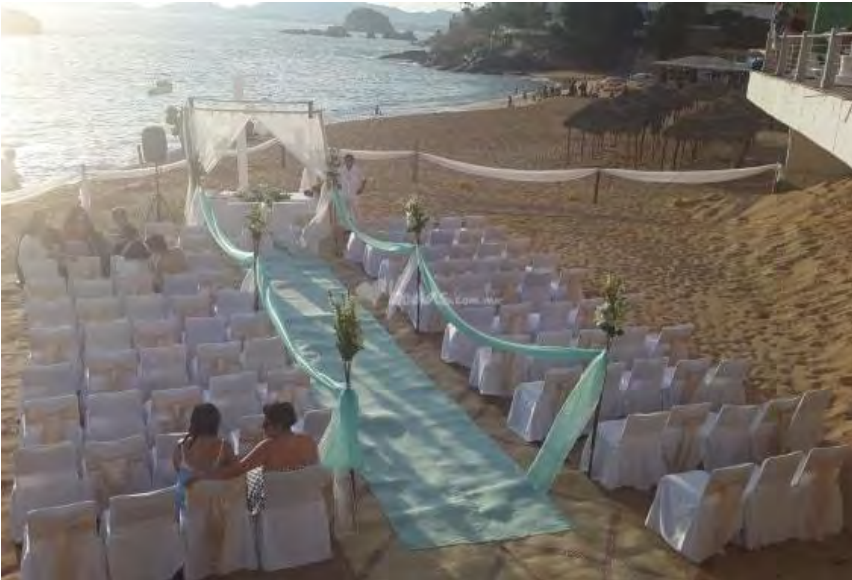
Imagen 3.3 Montaje para la ceremonia