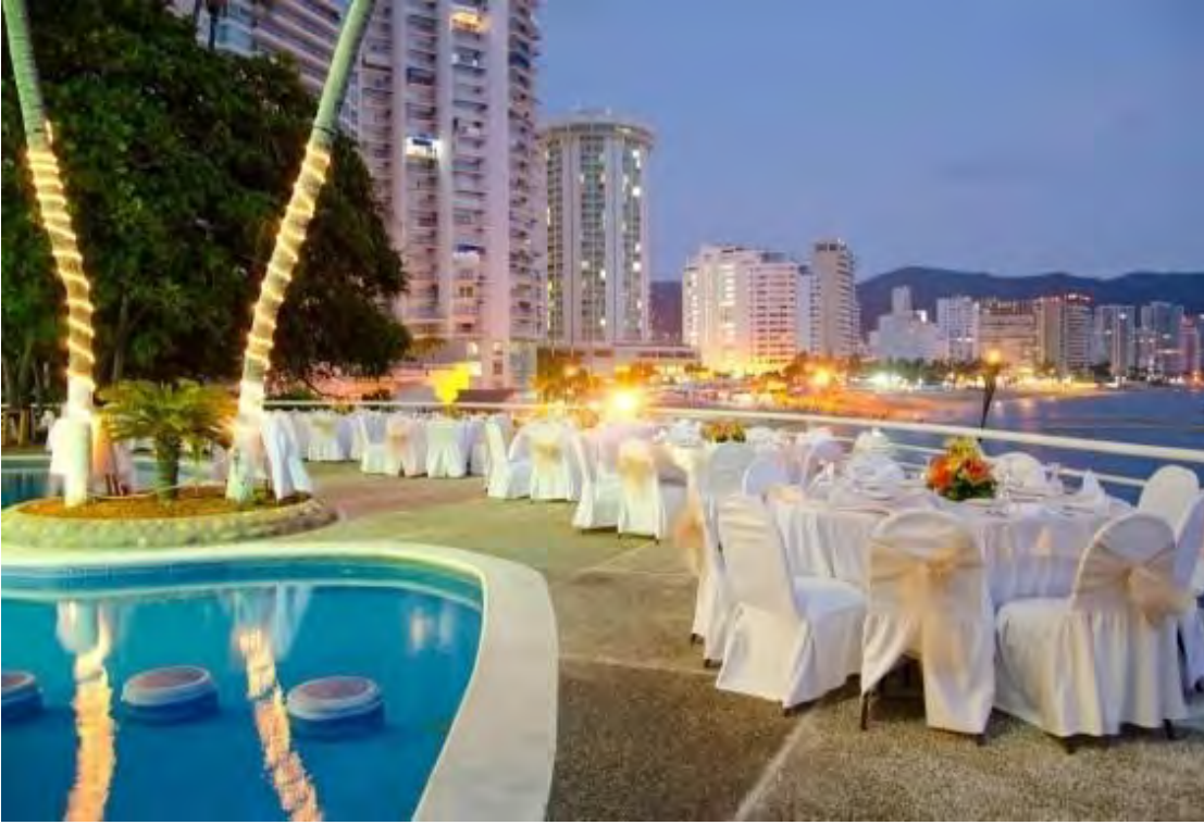
Imagen 2.6 Holiday Inn Resort Acapulco Montaje para la ceremonia