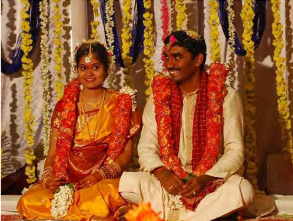
Imagen 1.2 Ceremonia de una boda del rito hindú