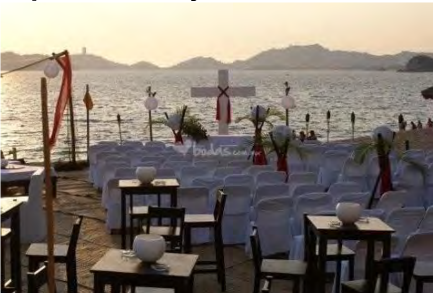
Imagen 3.1 Montaje de ceremonia