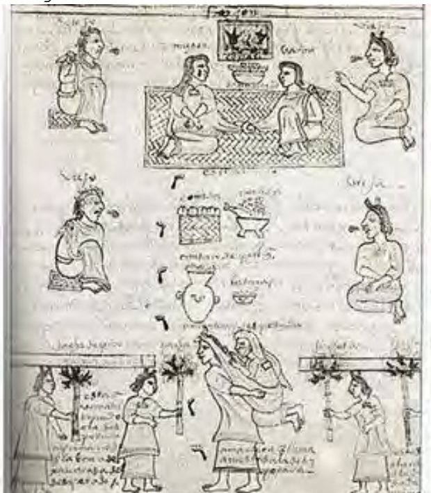
Imagen 1.5 Boda entre los mexicas