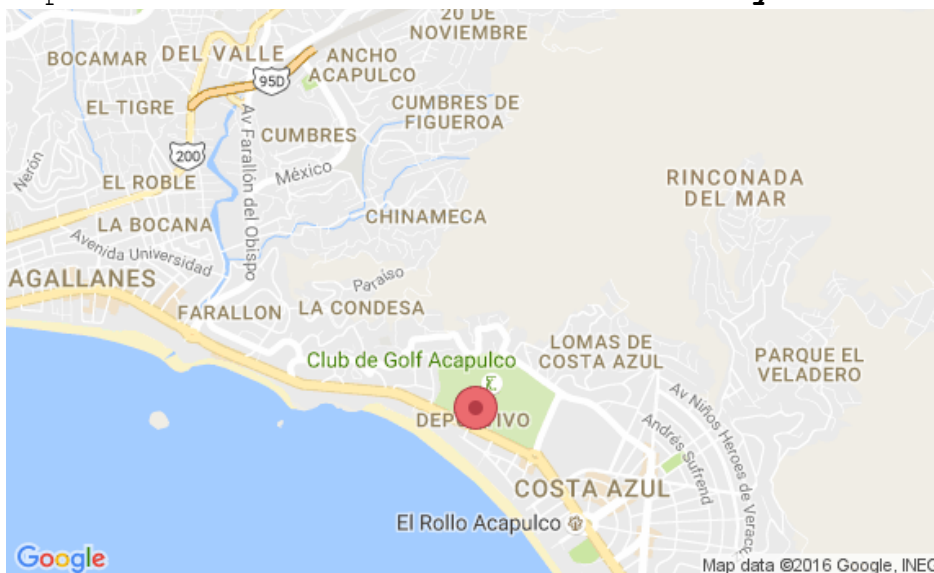
Mapa 2.4 Localización del Hotel Holiday Inn Resort Acapulco