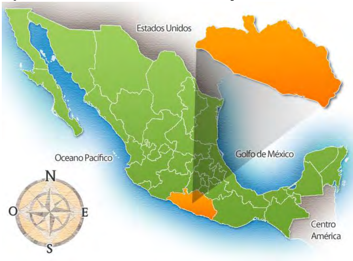
Mapa 2.1 El estado de Guerrero en la República Mexicana