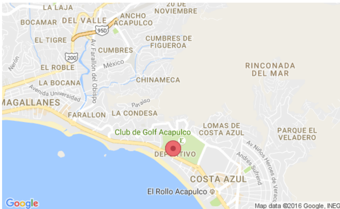
Mapa 3.1 Localización del Hotel Elcano