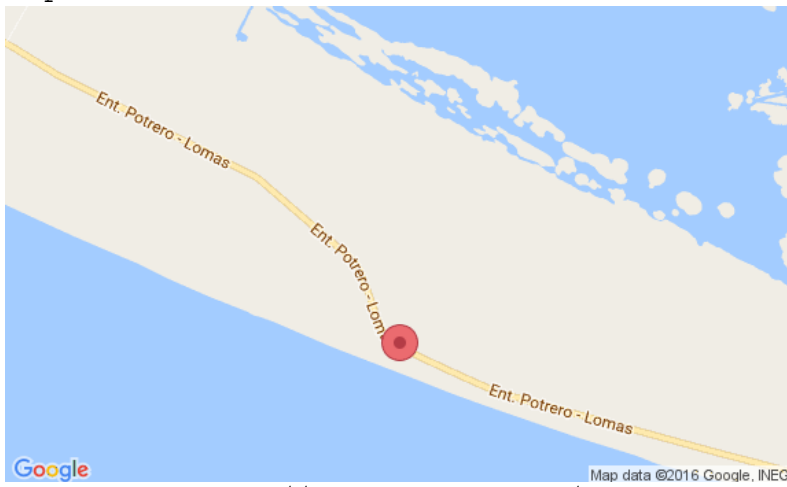
Mapa 2.5 Localización del Mishol Hotel & Beach Club