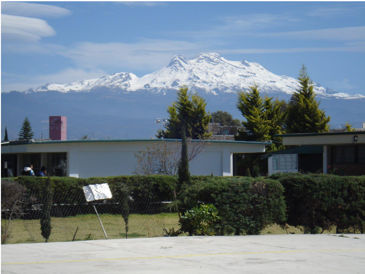
Foto del CBT No. 2 GUILLERMO GONZÁLEZ CAMARENA.

La dirección de la escuela es Av. Colibrí, Col. Alfredo del Mazo, Ixtapaluca, MEX 01 55 1709 7526, ésta es la dirección de la escuela en la que se realiza la investigación sobre el acoso escolar.