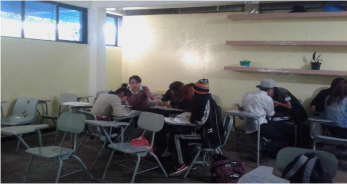
La burbuja soledad