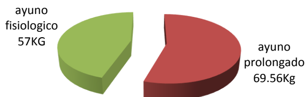
Comparación de las características antropométricas y el tipo de ayuno

En la tabla III se muestra la frecuencia de omisión del servicio alimentario en base al tipo de ayuno en los pacientes con obesidad, destacando que en el ayuno prolongado los servicios alimentarios que con mayor frecuencia se omiten son la cena con un 55% y el desayuno 33.33 %