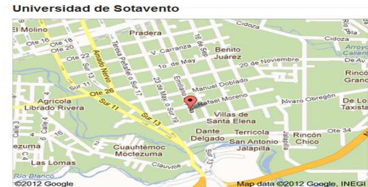
Figura 1. Croquis de ubicación de la esc. Secundaria Vasco de Quiroga, de Orizaba

La Universidad de Sotavento, Campus Orizaba. Se encuentra situada en la Avenida Emiliano Zapata, No. 175, Col. El Espinal, Orizaba, Veracruz.