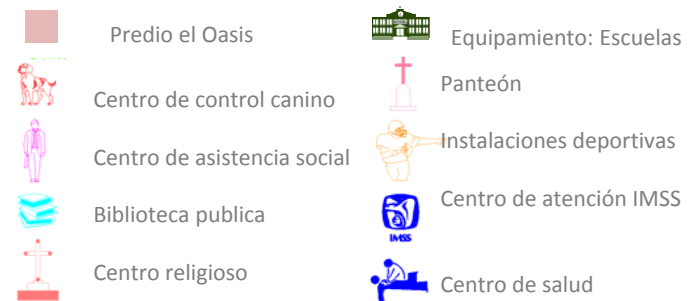
Figura 69. Equipamiento Urbano dentro de la zona .