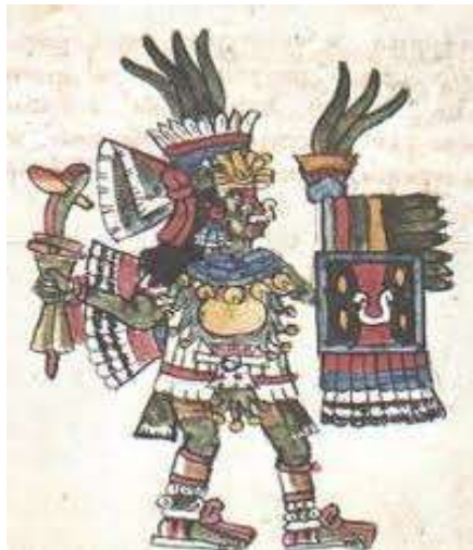
Tepoztécatl (Bebedor de pulque con hacha). 3

del templo dedicado a su culto, y que era venerado por peregrinos que llegaban desde Chiapas y Guatemala ( Ver anexo 2-fotografía 5 ). “Su carácter de mito normativo lo basa en la comparación con la leyenda del Popol Vuh, en la que los bebedores que inventan la primera bebida fermentada, suben al cielo para formar el grupo de las Pléyades. Este Tepoztécatl, pulquero, fue venerado en Tepoztlán como ídolo de piedra que resistió a posteriores asaltos católicos”( p.34-35).