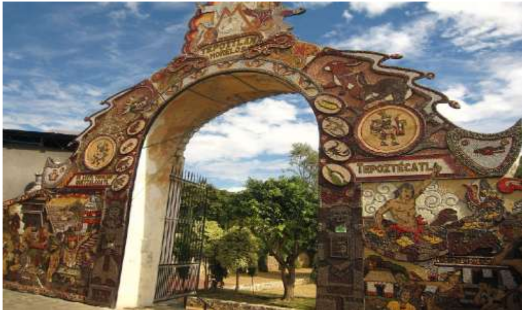
FOTOGRAFÍA 6-“PORTAL DE SEMILLAS EN HONOR A TEPOZTÉCATL”.