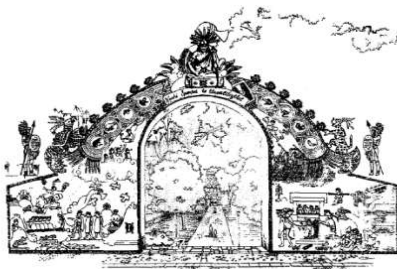
Mural de 1998, presentado por Corona y Pérez .

Según lo observado por Corona y Pérez (1999), todas las imágenes que se encontraban en el mural del 98 estaban revestidas con símbolos y temas prehispánicos que representan la historia del pueblo, sus montañas, su héroe cultural y los animales que simbolizan a cada uno de los barrios (p. 64).