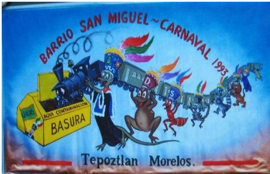
Muro: Los 8 barrios en contra del tren 7

Defender las costumbres y tradiciones ante estos proyectos fue un gran cimientto para afrontar lo que posteriormente se conoce como “la lucha contra el club de golf”.