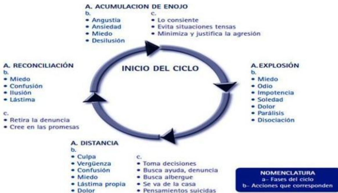
Figura 1. Círculo de violencia

integrantes de la familia, en la invisibilidad del hogar y que en ocasiones son tangibles o intangibles, y que influyen los factores sociales y culturales, pero que la importancia de dar solución a esta problemática es prioritaria. Ejemplos de violencia son la violencia física, que son acciones como abofetear, golpear con el puño, dar patadas, quemar, herir con objetos o armas y otros similares. La violencia psicológica son los insultos amenazas, burlas, ridiculización, indiferencia desvalorización o crítica permanente utilización de lenguaje altisonante (groserías) entre otras acciones. En la violencia sexual la manifestación más evidente es la violación. En la violencia económica, el control del dinero y de los bienes materiales de la familia y omisiones de las necesidades básicas, el robo, fraude o destrucción de los bienes familiares son las principales características. Estas conductas agresivas son recurrente, incrementando la frecuencia e intensidad donde promesas y reconciliaciones constituyen un círculo de violencia, el cual debe identificarse para poder eliminarse; sin embargo, es complicado y difícil de romper (Corsi, 1999) en (Barcelata, 2005). (Ver figura 1).