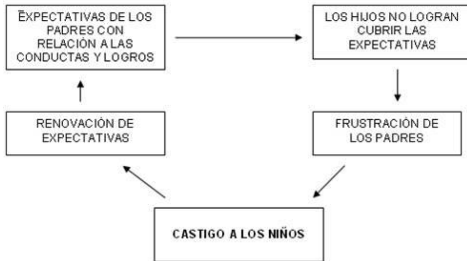
Figura. 2. El ciclo del maltrato infantil.