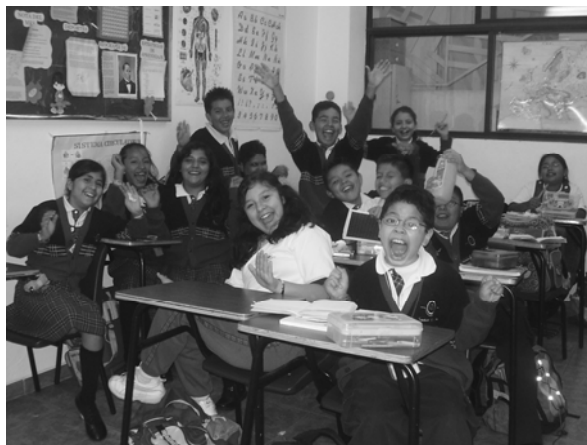
Fig. 5. Alumnos de 5º.