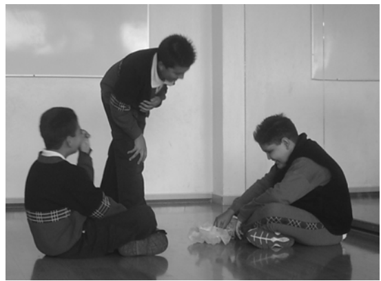
Fig. 5. Alumnos de 5º improvisando.