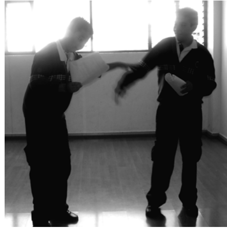
Fig. 3. Alumnos de 6º ensayando.