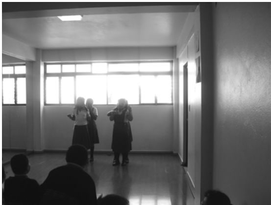
Fig. 2. Alumnos de 4º.