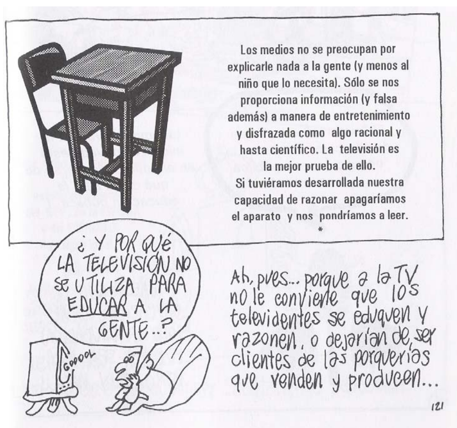
Figura 1. Rius, El fracaso de la educación en México , p.121.

Educar al niño debería ser CAPACITARLO para que conozca lo que llega por todos los medios (padres, maestro, medios de comunicación) y sepa ordenar, reflexionar y aceptar o rechazar toda esa información.