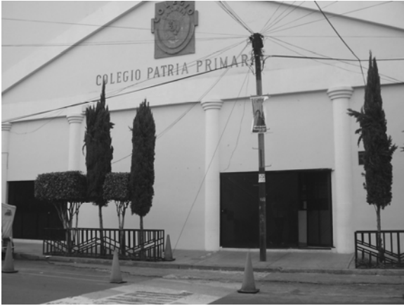
Fig. 1. Fachada del Plantel Ángel.