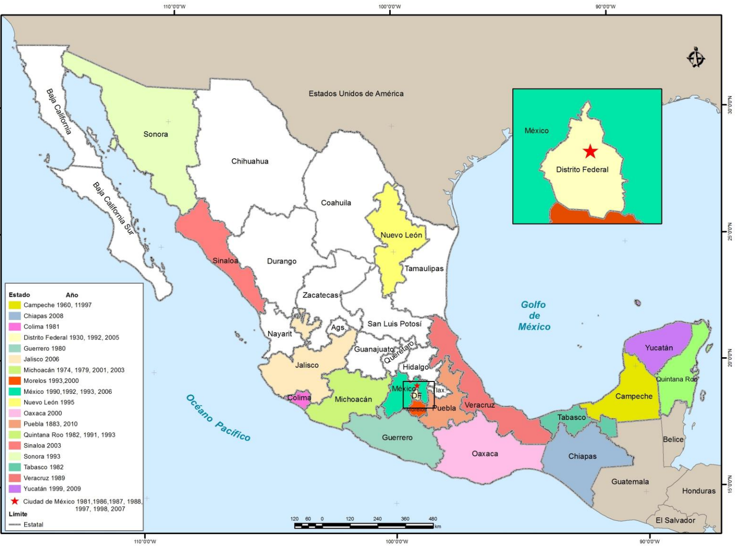
Figura 3.2. Territorios de México cartografiados en Atlas de la Biblioteca Antonio García Cubas, Instituto de Geografía, UNAM