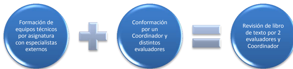
Diagrama 2.- Procedimientos para la evaluación de los libros. Elaborado a partir de la información del Acuerdo 385

Con la normatividad para la autorización de libros de secundaria en que se basó la Dirección General de Materiales Educativos como: la Ley General de Educación, el Plan y Programa de Estudio y el Acuerdo 385, el Procedimiento para la evaluación de los libros de texto se desarrolló de la siguiente forma (Diagrama 2):