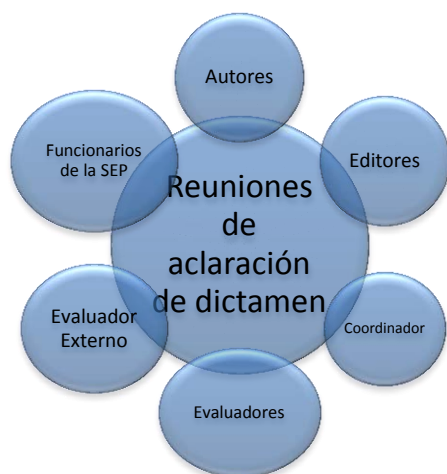
Diagrama 3. Actores involucrados en las Reuniones de aclaración de dictamen.

En el caso de la primera versión del Libro de Geografía de México y del Mundo, el dictamen fue No Favorable, por lo cual se contempló la realización de una reunión para la aclaración de dictamen, la cual se esboza en el Diagrama 3