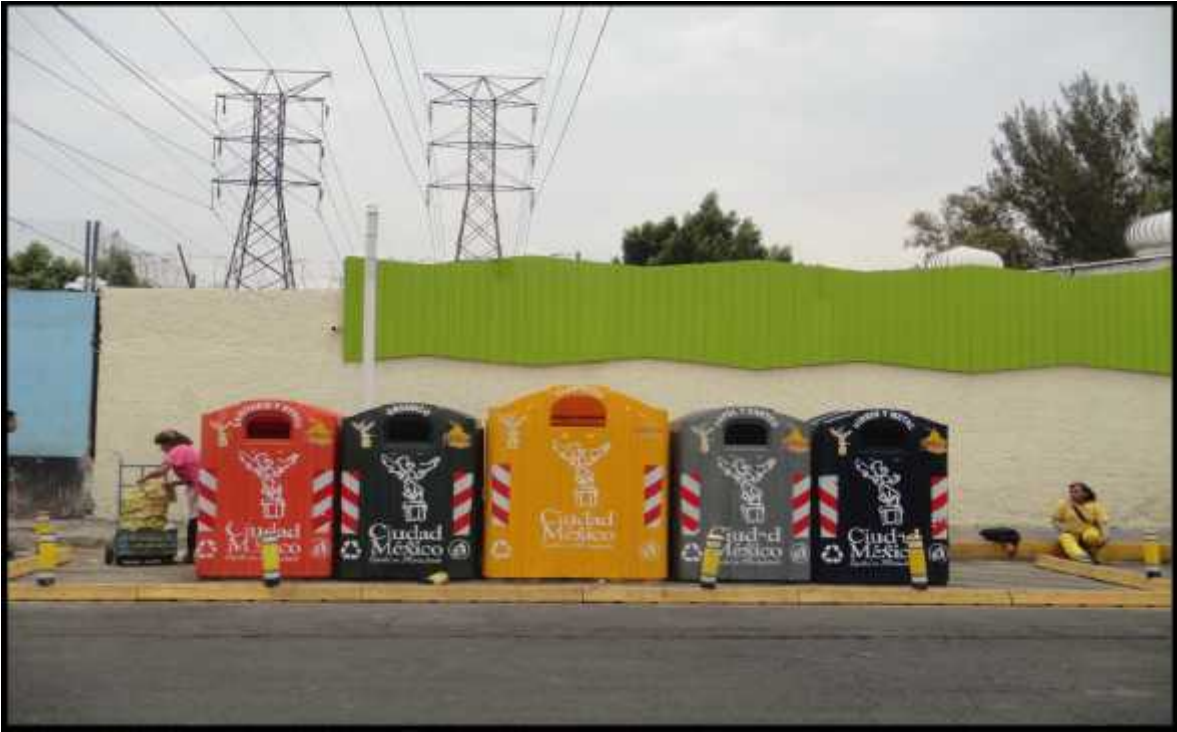
Contenedores de basura auspiciados por el Gobierno del Distrito Federal en la delegación Iztacalco.