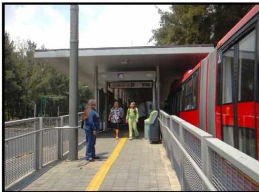
Estación de Metrobús en la actualidad.