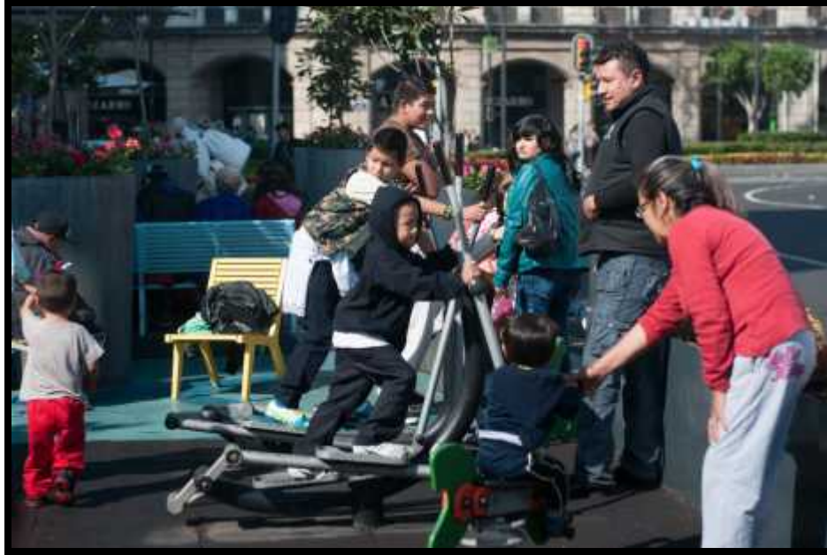
Un grupo de niños utilizan instalaciones de un Parque de Bolsillo ubicado en el primer cuadro de la ciudad.