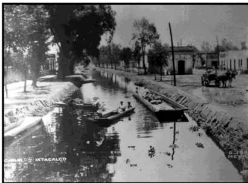
El río Santa Anita, de Iztacalco, durante 1924.