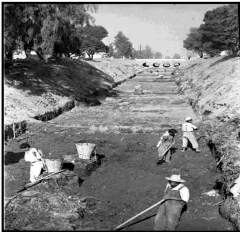
Trabajadores agrícolas en las obras en el puente de Iztacalco, en 1938.