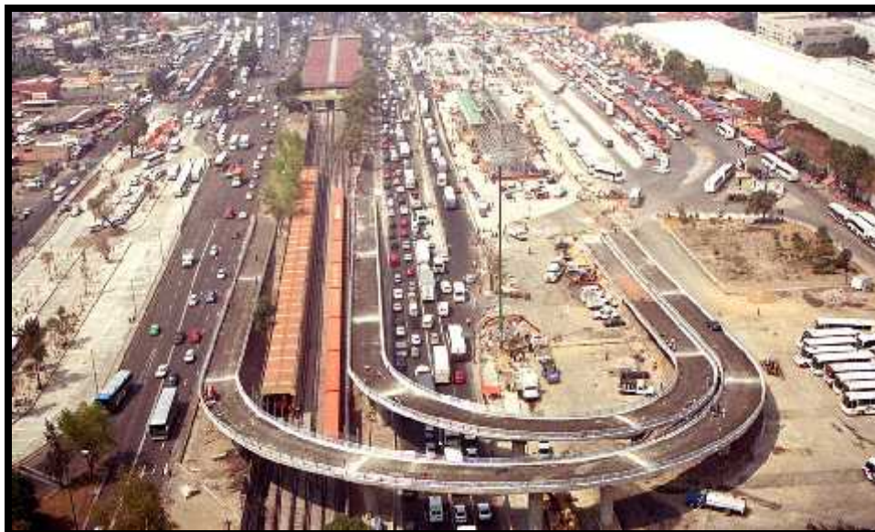
Vista aérea del paradero del Metrobús ubicado en Indios Verdes a un día de su inauguración, el 17 de junio, de 2005.