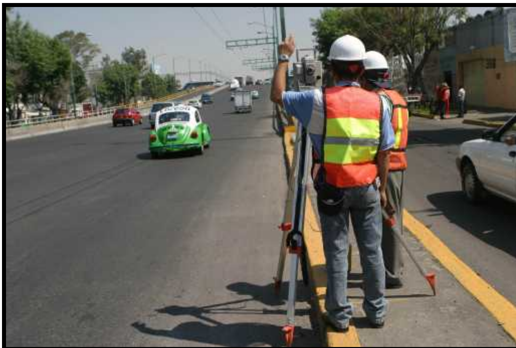
Topógrafos comienzan planeaciones para la realización de nuevos puentes peatonales sobre el eje 3 y 4 en la delegación del Iztacalco.