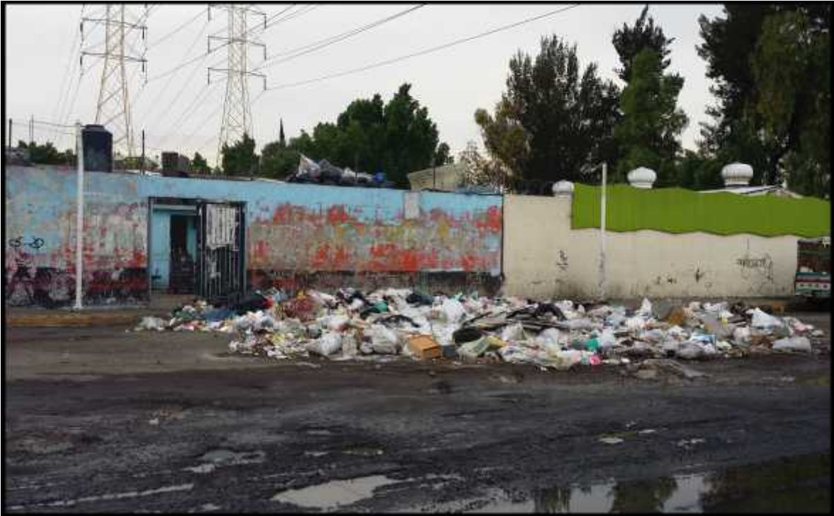
Desechos de materiales arrojados en lo que fueron algún día los contenedores de basura de la anterior fotografía.