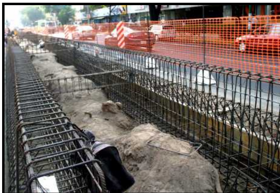
Aspecto de la realización de la construcción de las paradas del Metrobús sobre avenida Insurgentes, en 2005.