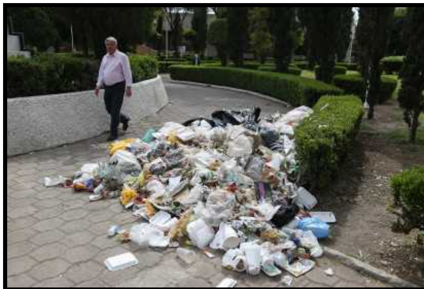
Basura acumulada en la explanada de la delegación Iztacalco.