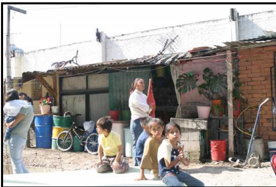
Aspecto de una vivienda habitada por integrantes del Frente Popular Francisco Villa (FPFV) en la delegación Iztacalco.