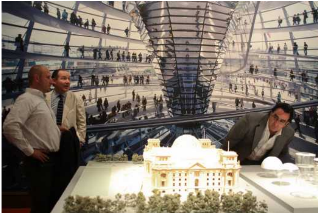
Al menos 227 proyectos del despacho Norman Foster + Partners que ha realizado en 20 países: planos, dibujos, maquetas, fotografía de gran formato video, forman parte de esta exposición arquitectónica en el Antiguo Colegio de San Ildefonso, en 2010.