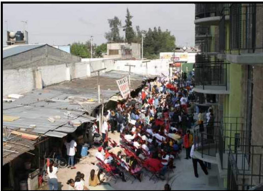
Integrantes del Frente Popular Fransico Villa (FPFV) durante una reunión en la explanada de su unidad habitacional en la delegación Iztacalco.