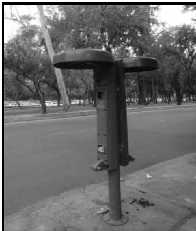
En la Avenida Río Churubusco se encontraban contenedores para basura orgánica e inorgánica, sin embargo han sido substraídos por los propios ciudadanos.