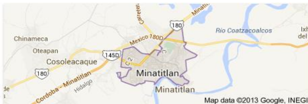
14 Mapa satelital de la ubicación de Minatitlán.

Dicho Municipio está ubicado al norte del Istmo de Tehuantepec y región Olmeca del estado de Veracruz, en las coordenadas 17° 59' latitud norte y 94° 33' longitud oeste, a una altura de 20 metros sobre el nivel del mar con extensión territorial de 4,123.91 km 2 , cifra que representa el 5.66% total del estado. Limita al norte con la ciudad costera de Coatzacoalcos y el municipio de Cosoleacaque, al noreste con Ixhuatlán del Sureste, al este con Moloacán y Las Choapas, al sur con Uxpanapa, y al suroeste Hidalgotitlán y Jáltipan.