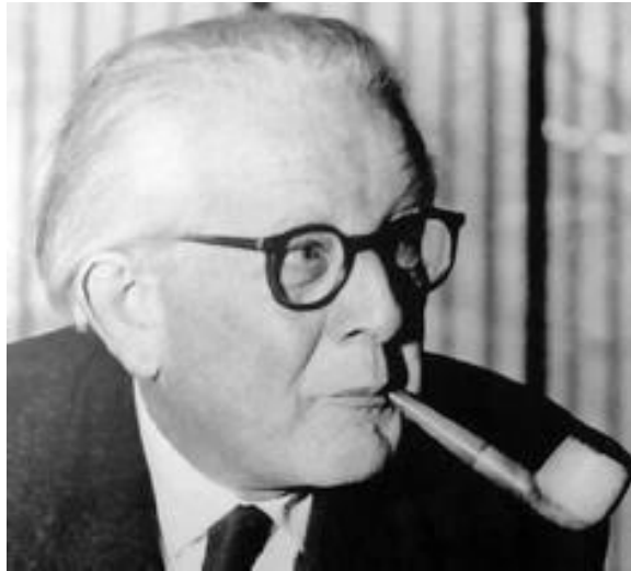
Imagen 1. Jean Piaget

En este apartado, es importante resaltar la importancia que Piaget plantea en el aprendizaje condicionado a las etapas y procesos de la vida del individuo, básicamente tomando como referencia la etapa de la infancia a la madurez.