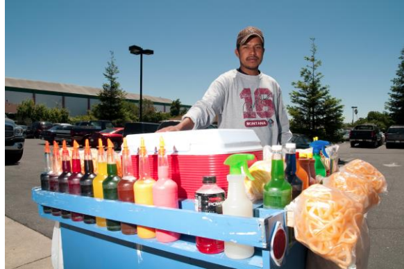
Imagen 4 Parte del benchmarking consistió en estudiar el uso tradicional del hielo

artículos presentados por la competencia. El benchmarking físico consiste en salir a las calles, observar y encontrar los elementos que cada persona puede aportar. Además de manipular físicamente las tecnologías consideradas parte de la competencia. Identificar la manera de interacción de los usuarios con el objeto en estudio a través del diálogo para conseguir información relevante de primera fuente.