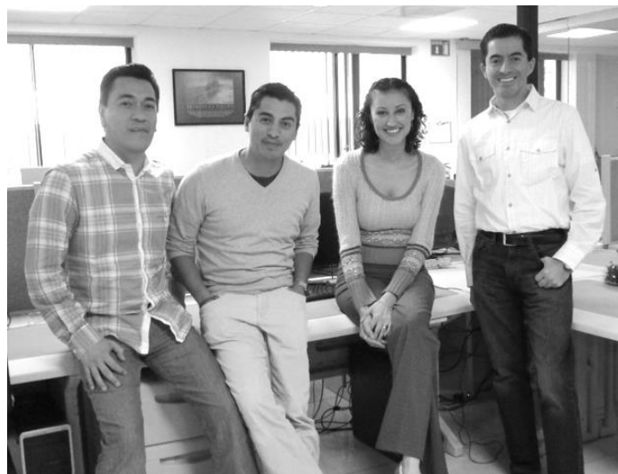
Imagen 1 El equipo corporativo de MABE