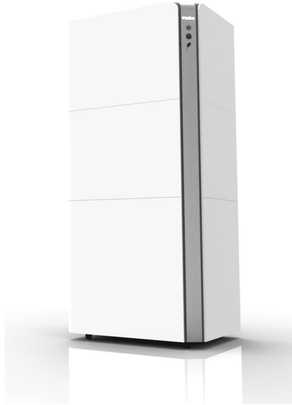
Imagen 7 Render del concepto del producto final

Las especificaciones técnicas y aspectos de diseño mecánico, electrónico y de interface se encuentran en el capítulo 9 Final Documentation.