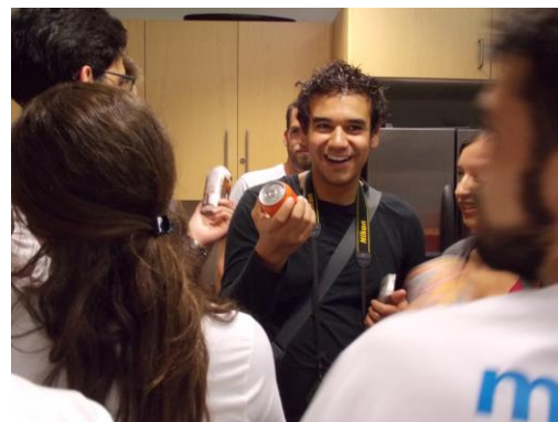
Imagen 8 El Polar Roller y usuarios durante el EXPE