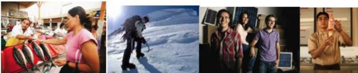
Imagen 5 Se estudió la interacción con el hielo en diversos ambientes

Uno de los primeros pasos realizados fue la identificación y observación de los usuarios potenciales, sus hábitos y necesidades. Se observó la manera en la que los usuarios interactuaban con el hielo y más específicamente con las máquinas dispensadoras de hielo de sus hogares. Se observó cómo, cuándo y para qué usaban el hielo y se entrevistó a diversos usuarios para conocer su opinión sobre los sistemas actuales, qué consideraban adecuado y qué creían podía mejorarse.