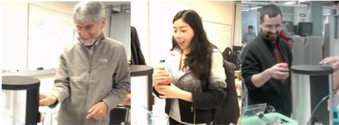
Imagen 6 Los prototipos de experiencia permiten conocer la reacción de los usuarios a una función

Ambos prototipos están íntimamente relacionados entre sí. Se puede comenzar con cualquiera de los dos para ayudar a deducir el otro. Si no puede hacer que la función crítica suceda, no debe ser parte de la experiencia crítica y si el prototipo de experiencia crítica muestra que el usuario encuentra desagradable una función, entonces no debe realizarse el prototipo de función crítica.