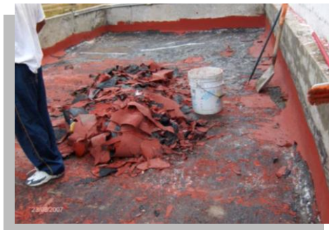
Fig. 27.- Es recomendable retirar lo más posible el impermeabilizante existente puesto que de no hacerlo pone en riesgo los trabajos nuevos por realizarse así como los materiales.

Cuando existe algún tipo de impermeabilizante es recomendable retirarlo en su totalidad, ya que en ocasiones personas con falta de experiencia recomiendan retirar solo las partes afectadas o deterioradas, lo cual es incorrecto puesto que se pone en riesgo todo el trabajo y material nuevo por aplicarse; al finalizar el desprendimiento del material se debe inspeccionar la calidad constructiva de la losa para establecer una impermeabilización correctiva o preventiva, posteriormente se debe realizar una nivelación, solo si es necesario, de igual manera será para el caso de losas nuevas.