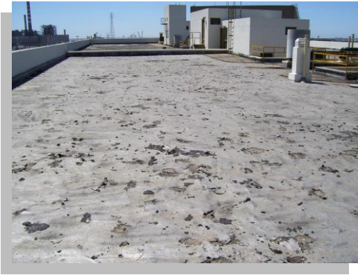
Fig. 2.- Se muestra un deterioro significativo del producto impermeable existente.