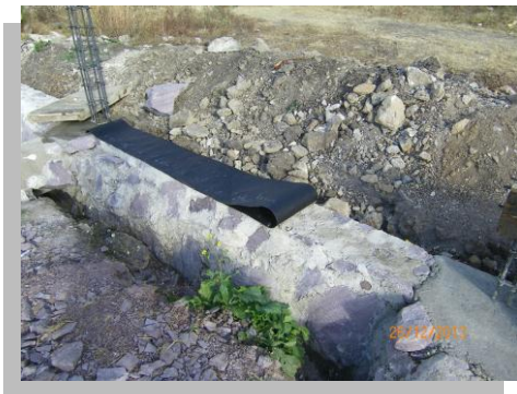
Fig. 40.- Antes de impermeabilizar la corona de la cimentación, se presenta la membrana de cartón asfaltado a fin colocar la cantidad requerida

Al mismo tiempo que se va aplicando el impermeabilizante, se va colocando una membrana de refuerzo de polietileno, ajustándola sobre el impermeabilizante todavía fresco, para que no tenga abolsamientos ni arrugas. Los traslapes, en la unión de las membranas, deberá ser de 10cm. Arriba de la membrana de refuerzo se aplica una segunda capa de impermeabilizante, que se cubre, todavía fresca, con una capa de arena limpia cernida. Luego se deja secar por 24 hrs. No es conveniente el uso de emulsiones de base agua en las coronas de los cimientos. Otro material frecuentemente utilizado en la impermeabilización de cimientos es el asfalto oxidado el cual se derrite y se aplica en dos capas que en medio se coloca una membrana de fieltro asfáltico o cartón asfaltado, y el acabado se hace colocando gravilla o arena pesada mientras el asfalto aun sigue caliente.