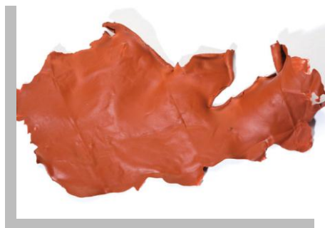
Fig. 17.- Apariencia de un impermeabilizante Elastomérico, que a diferencia de los acrílicos se presentan en tres colores, terracota, verde y blanco.

Los impermeabilizantes elastoméricos son productos emulsionados, elaborados con resinas acrílicas o acrílicas estirenadas base agua, que se aplica en forma líquida y que, al secar completamente, forma una membrana flexible, resistente a las condiciones ambientales e impermeable al paso del agua en losas monolíticas, techumbres de lamina o con aislamiento térmico. La presentación de este tipo de impermeabilizantes es en color terracota o blanco.