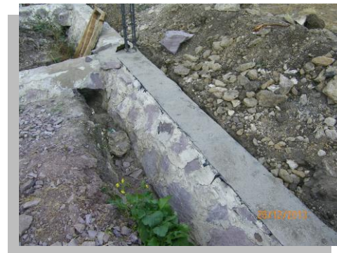
Fig. 41.- Se observa la cimentación ya impermeabilizada y con un acabado de arena pesada.

Como se menciona en el apartado II.6, para resolver un problema se debe hacer uso del ingenio, llevar a cabo todas aquellas ideas que den solución de manera práctica y eficiente, por ejemplo, se puede implementar la construcción de drenes para el desalojo o dar paso al agua a fin de evitar afectaciones a la cimentación.