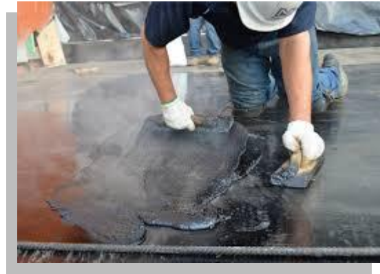
Fig. 33.- Aplicación de la emulsión asfáltica.

Ya colocada la membrana se deja secar 24 hrs. y se aplica la segunda capa de emulsión, la cual secara completamente en 7 días. Un sistema multicapa, con dos o tres membranas de refuerzo, con capas de emulsión entre una y otra, prolonga la duración de este sistema. Las emulsiones invariablemente deben ir aparentes protegidas de la insolación con algún acabado.