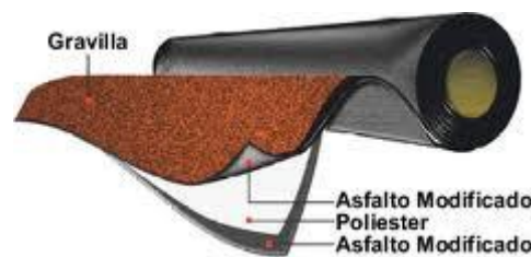
Fig. 21.- Componentes principales de un manto prefabricado, cabe señalar que la membrana puede variar en este caso se presenta una membrana de poliéster.

Para eliminar la laboriosa tarea de colocar uno a uno los productos, se han creado los impermeabilizantes prefabricados, que son membranas compuestas de varias capas y refuerzos que se aplican, prácticamente, como una alfombra en rollo. (Fig. 16)