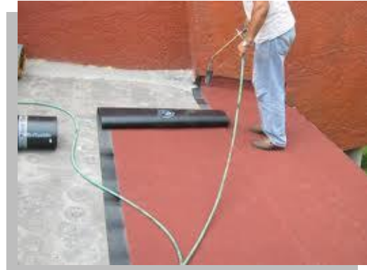
Fig. 34 y 35.- En ocasiones la llama del soplete se pasa por encima del acabado aparente, esto es una mala practica ya que se puede quemar la gravilla que viene adherida ocasionando que se desprenda y así quede expuesta la capa de asfalto..

Conviene que la parte adherida se presione con un rodillo, de tal manera que por los bordes del lienzo salga, aproximadamente, 1cm de material.