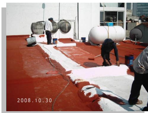
Fig. 36.- Sistema de impermeabilización elastomérico con membrana de refuerzo.

Los sistemas acrílicos se pueden colocar con éxito sin membrana de refuerzo, extendiendo dos capas, a razón de un litro por metro cuadrado. La primera capa se deja secar 24 hrs. y luego se sobrepone una segunda capa que seca en tres días. Se puede aplicar con brocha, cepillo, escoba o equipo de aspersión.