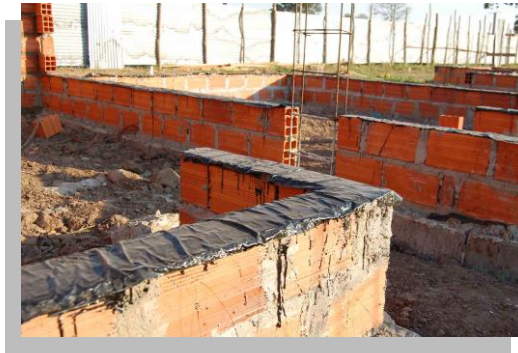
Fig. 39.- En algunas construcciones se impermeabiliza la corona de la cimentación pero además se impermeabiliza también la segunda hilada de mampostería a fin de garantizar que la humedad no suba por los muros.

Para colocarlos, la superficie de la corona debe estar seca, sin partes flojas o sueltas, ni porciones salientes, filosas o puntiagudas. Enseguida, sobre la corona se extiende una capa de impermeabilizante ligeramente más gruesa que la que se pondría para impermeabilizar un techo, a razón de un litro y medio por cada dos metros cuadrados de corona.