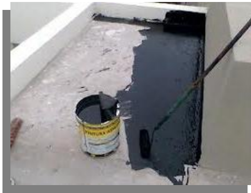
Fig. 4.- Imprimación de una superficie a impermeabilizar.

Los primarios (en inglés: primers) se llaman así por que son los primeros productos que se aplican al impermeabilizar. Con ellos se hace la imprimación o preparación de la superficie que se va a cubrir. Son líquidos impermeabilizantes de baja viscosidad que se aplican en frío para saturar la superficie, tapar los poros y las fisuras, así como cubrir el polvo y las pequeñas partículas sueltas de la superficie.