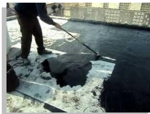
Fig. 30 y 31.-Aplicación del impermeabilizante asfáltico en caliente.