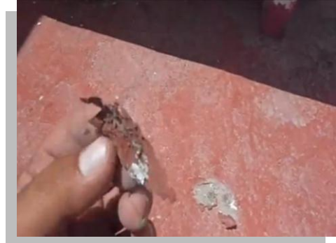
Fig. 19 y 20.- Una de las principales desventajas de los impermeabilizantes acrílicos, es el fácil desprendimiento que presentan al cabo de cierto tiempo a causa de la intemperización.