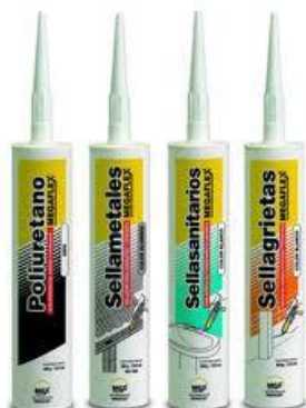
Fig. 5.- Los selladores son frecuentemente utilizados para resanar grietas antes de aplicar cualquier sistema de impermeabilización.

impermeabilizantes acrílicos, para sellar y tapar fisuras. En tanto que los selladores de silicón se utilizan para calafatear y sellar las juntas de la ventanearía y la herrería.