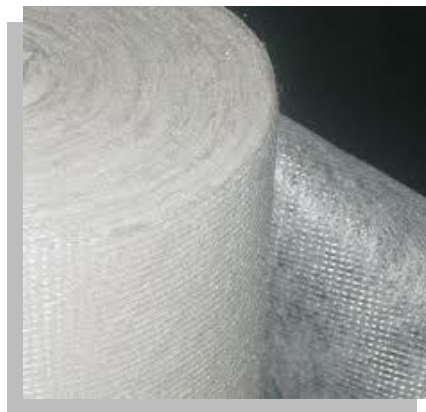
Fig. 9.- Membrana de poliéster.

Las membranas de poliéster, son mas caras que las de fibra de vidrio, se utilizan casi exclusivamente en sistemas de impermeabilización en frío, debido a que sus fibras son altamente compatibles con los solventes de tales sistemas.