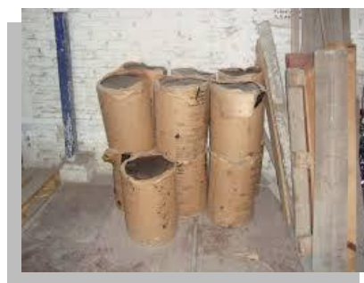
Fig. 14 y 15.- Asfalto oxidado que comúnmente suele conocerse como chapopote.

Los asfaltos refinados al vapor resultan de hacer pasar a los asfaltos oxidados vapor de agua 500°C, también se les conoce como asfaltos cortados o cementosos, se hacen líquidos al agregarles solventes, como gasolina. Se conocen también como asfaltos de base solvente y se manejan tres diluciones principales: asfaltos cortados de curado rápido, de curado medio y de curado lento. Los asfaltos cortados son los más durables, pero se deben aplicar solamente sobre superficies secas, por que la humedad y los vapores que quedan atrapados bajo ellos no podrán salir y producirán ampollas. Sin embargo, para resolver el problema de las ampollas, algunos de estos asfaltos tienen solventes que aceleran la evaporación de la humedad atrapada en las losas de concreto.