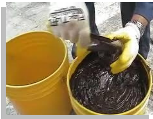
Fig. 16.- Por sus características las emulsiones asfálticas son muy utilizadas en trabajos de impermeabilización.

Las emulsiones de asfalto son, en general, las más económicas después del asfalto caliente. Sin embargo, no son recomendables para lugares sujetos a una humedad constante, ni para climas muy fríos.