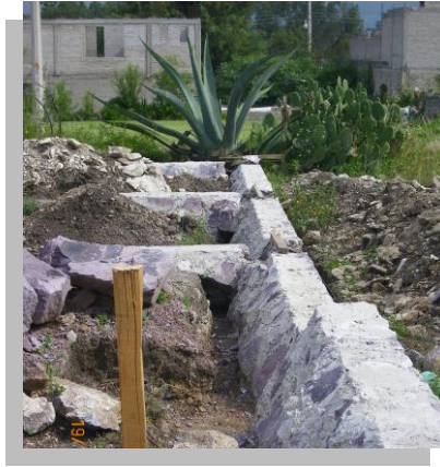
Fig. 42.- En ocasiones resulta conveniente la implementación de drenajes en la cimentación a fin de desalojar o dar paso al agua subterránea.

Es importante tener en cuenta que de nada sirve haber realizado un excelente trabajo de impermeabilización si el nivel de material de relleno se encuentra por encima de la corona del cimiento, pues la humedad subiría por el muro afectándolo; para evitar este tipo de situaciones es conveniente hacer una correcta planeación de los niveles de construcción considerando el material que sirva de relleno y aquel que se encuentre en las colindancias.