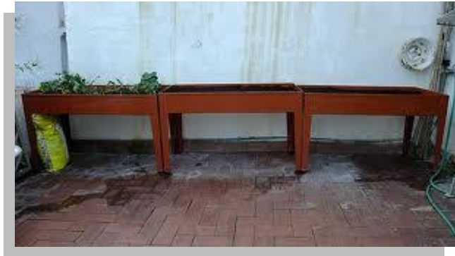
Fig. 3.- En este caso el sistema de enladrillado se ve afectado por el escurrimiento proveniente de unas jardineras