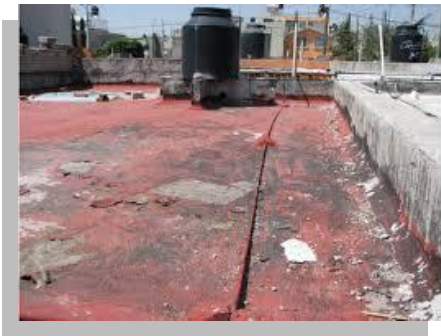
Fig. 25.- En una inspección visual se puede apreciar la condiciones en las que se encuentra el elemento a impermeabilizar.

Una buena inspección visual consiste en observar el estado en que se encuentre la losa esto es; en caso de que cuente con algún tipo de impermeabilizante, si presenta encharcamientos, si se encuentra agrietado (piel de cocodrilo), si tiene desprendimientos, si existen chaflanes, si existen otros elementos que obstruyan o afecten la impermeabilización como lo son tuberías, tanques de gas, jardineras, etc., en caso de ser una losa libre de cualquier impermeabilizante se debe observar la calidad de la construcción para determinar si se realizara una impermeabilización correctiva o solo preventiva, se debe observar si se cuenta con la pendiente necesaria para desalojar el agua, determinar el punto o los puntos por donde se desalojara el agua para la posterior instalación de tubería o canaleta.