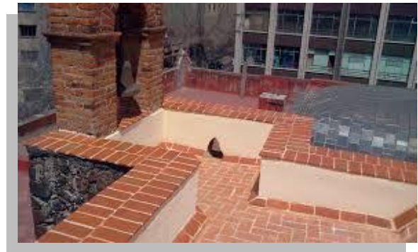
Fig. 10 y 11.- Del lado izquierdo se puede apreciar la construcción del sistema impermeable a base de enladrillado mientras que del lado derecho se observa un trabajo terminado.

Este sistema es muy común en nuestros días, siendo muy efectivo para evitar el paso del agua y la humedad. Este procedimiento no utiliza ningún producto asfáltico, únicamente recurre a terminar esta colocación de acabado con una lechada de cemento gris, arena cernida y agua, el cual al endurecerse forma una capa impermeable.