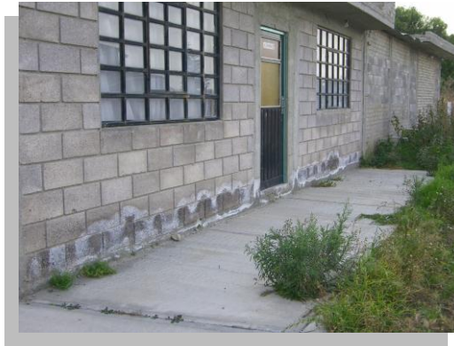
Fig. 1.- La humedad sube a traves de la pared por efecto de capilaridad, trayendo consigo sales minerales que pueden afectar más aun los materiales de construcción.

El agua acumulada por capilaridad provienen del subsuelo, debido a un exceso de agua en el terreno donde están afianzados los cimientos del edificio, aunque también pueden originarse en encharcamientos o saturaciones de agua, sea por la existencia de corrientes subterráneas de agua o por la caída de lluvias intensas, sin que tengan buen escurrimiento alrededor de edificio. El agua puesta en contacto con los muros del edificio penetra en ellos y por capilaridad asciende a las plantas superiores, dada la falta de impermeabilización de los cimientos y muros.