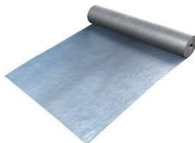
Fig. 6.- Rollo de fieltro asfáltico o cartón asfáltico.

Las membranas de fieltro asfáltico o cartón impregnado son las de mayor uso en el mundo. El fieltro está hecho con un entrelazado prensado de fibras en desorden, en vez de una trama y una urdimbre como en los tejidos. Las fibras que se usan son generalmente de celulosa, madera, algodón y, algunas veces, fibras sintéticas como refuerzo, que son sometidas al calor, humedad y presión con un adhesivo ligero. Una vez laminadas se impregnan con asfalto.