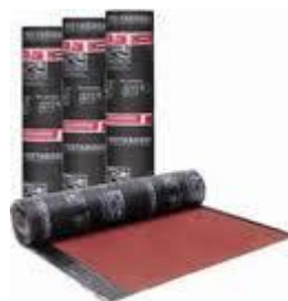
Fig. 22.- Comercialmente los rollos de impermeabilizante prefabricado se presentan en tramos de 10 metros de largo por 1 metro de ancho.

Los asfaltos modificados a base de una resina de polipropileno atactico, o APP, son asfaltos elativos que se pueden estirar hasta dos veces y media su tamaño original. Son relativamente flexibles soportan temperaturas muy elevadas, propias de los climas calientes y resultan muy duros y resistentes al trafico. Se aplican y adhieren a la superficie solamente por termofusión.