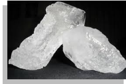
Fig. 12 y 13.- Del lado izquierdo se observa el tipo de jabón requerido para impermeabilizar mientras que del lado derecho se puede observar el alumbre o sulfato de aluminio.

El alumbre es sulfato de aluminio, que se consigue en algunas ferreterías o tlapalerías y en las tiendas que venden productos para mantenimiento de albercas.