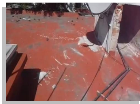
Fig. 28 y 29.- Debido al descuido que se tiene en las azoteas se generan diversos puntos críticos que se deben reforzar.

Los refuerzos consisten en aplicar una imprimación, después impermeabilizante y luego un trozo de membrana de refuerzo, seguido de otra capa de impermeabilizante y de una segunda membrana de refuerzo ligeramente más grande que la primera, que enseguida se cubre con más impermeabilizante.