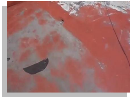
Fig. 26.- Se puede observar la existencia de encharcamientos por la acumulación de arenilla.