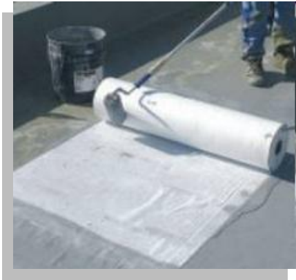
Fig. 32.- Aplicación de emulsión asfáltica con membrana de refuerzo.