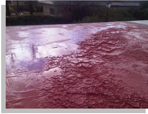
Fig. 37.- Se debe evitar aplicar productos acrílicos en presencia de agua o con riesgo de lluvia ya que como se puede apreciar en la imagen, el material impermeable puede reemulsificarse ocasionando así una pérdida total de material, tiempo y trabajo invertido.