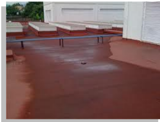
Fig. 24.- En la imagen se puede observar la deficiente calidad de impermeabilización ya que la superficie presenta encharcamientos ocasionando que el deterioro del producto impermeable.

Es el elemento estructural que mas problemas de permeabilidad presentan las viviendas, es bien sabido por los expertos en construcción que el concreto es un elemento totalmente impermeable, siempre y cuando tenga las atenciones debidas en cuanto a su colocación, vibrado y curado. Lamentablemente este tipo de elementos no se encuentran a cargo de personal capacitado para su construcción por lo que es muy frecuente la aparición de grietas y fisuras, a si como la falta de pendiente para desalojar el agua pluvial.