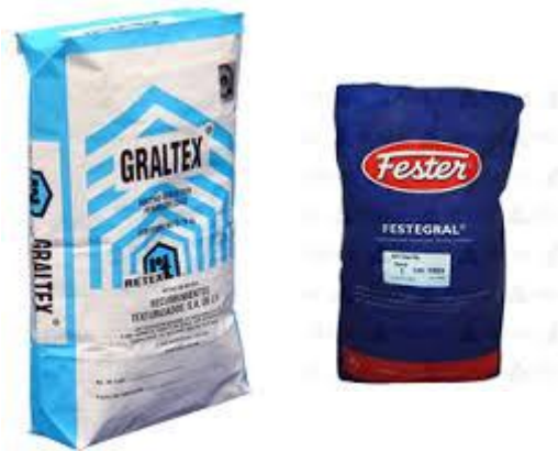
Fig. 23.- Los productos integrales resultan muy efectivos al incorporarse al concreto que se utiliza en la construcción de algún elemento.

Los impermeabilizantes cementosos o integrales para concreto, reducen la porosidad del cemento, haciéndolo mas impermeable. Hay unos que se agregan al concreto cuando este se mezcla. Al secar junto con el, cierran los poros y reducen la capilaridad, con lo cual aumenta la impermeabilidad del concreto, sin disminuir su resistencia.