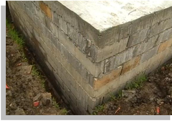
Fig. 38.- En la imagen se puede observar que la cisterna presenta una filtración en la parte inferior.