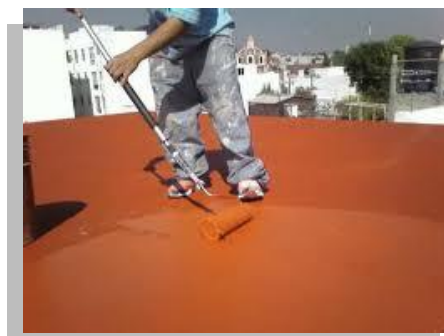
Fig. 18.- Aplicación de un impermeabilizante Elastomérico.

Estos productos tienen dos ventajas principales sobre los asfaltos: primero, son productos elásticos, que se pueden estirar varias veces su tamaño y regresan a su forma original; y, segundo, en general son más durables. No los hay de corta duración. Todos son de duración media o larga.