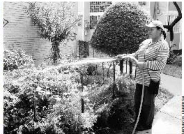
DENUNCIA. Panistas aseguran que gobierno del DF sólo busca afectar a la clase media con las altas tarifas en el cobro de agua