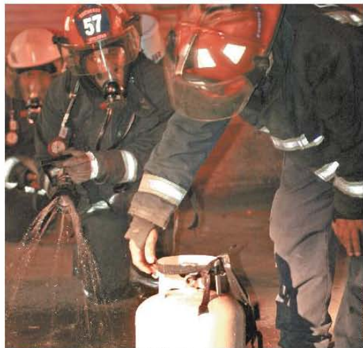
EMERGENCIA. Elementos de la Agencia de Seguridad Estatal al desactivaron el artefacto explosivo