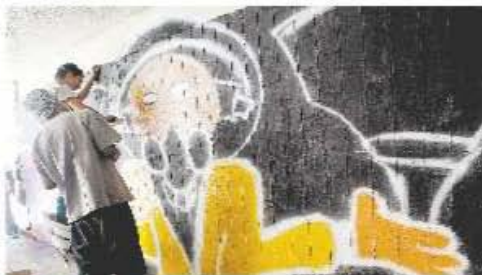
TERAPIA. La Comunidad Externa de Atención para Adolescentes llevó a cabo actividades con jóvenes adictos a las drogas

Supo dónde comprarla, después se dio cuenta que era un