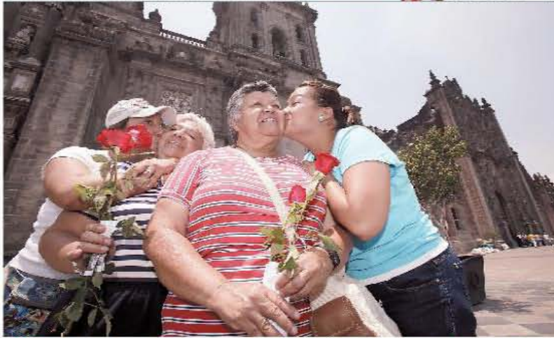
REGALOS. Muchos hicieron valer es de que "madre sólo hay una" y las llevaron a pasear y comer a establecimientos del Centro Histórico