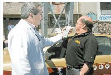
SEGURIDAD El diputado perredista Maximiliano Reyes propone endurecer castigo contra quienes manejen en estado de ebriedad.

buscaban impulsar la cultura de la responsabilidad de los automovilistas, de tal modo que si el conductor de la unidad excede el límite de la ingestión de bebidas alcohólicas, no haya la posibilidad de que un familiar que venga sobrio pueda llevarse el carro, sino que el arrotaje sea obligatorio. "No estamos violando los derechos humanos de nadie, ni estamos criminalizando a nadie", resalzó. En conferencia de prensa, aclaró que no sólo las personas que acuden a los bares o cantinas suelen conducir en estado de ebriedad, sino que hay una gran cantidad de ciudadanos que salen de fiestas, de celebraciones sociales o deportivas que también ingieren bebidas alcohólicas, y que pueden darse a cualquier hora del día. El perredista insistió en que las sanciones deben aplicarse a todas las personas que conducen en estado de ebriedad, salgan de donde salgan, y a la hora que sea, porque incluso hay información que señala que conductores de autobuses, micros y combis operan sus unidades en muchas ocasiones en estado de ebriedad.