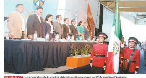
CEREMONIA. Los panistas de la capital del país realizaron ayer su 26 Asamblea Regional

EDICTO Al haber un fallo en el Distrito Federal que se le ha dado el nombre "Procedimiento de Ejecución de Sentencia" en el Estado de Querétaro.