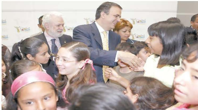
PRESENTACIÓN. Marcelo Ebrard, jefe de Gobierno capitalino, instaló ayer el Consejo de los Niños y las Niñas, que estará integrado por 32 menores