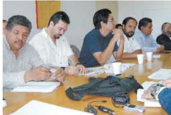
SINDICATO. Aspecto de las negociaciones en la Junta Local de Conciliación