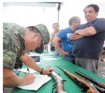
INTERCAMBIO En la delegación Álvaro Obregón, millares arrancaron con el programa de intercambio de armas de fuego. La SSP-DF destinará este año 10 mdp.

Para el próximo martes, 20 mil personas entre trabajadores, empresarios y gente que gusta de la vida nocturna se manifestarán en el Zócalo capitalino a favor de la nueva Ley de Establecimientos Mercantiles del Distrito Federal, la cual sería publicada en la gaceta oficial local en los próximos días. (Notimez)