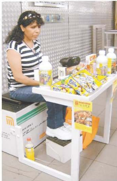
VENDEDORA. Integrantes de grupos de invidentes recibieron estos espacios dentro del Metro, antes se dedicaban a cantar en los vagones u ofrecer discos "pirata"