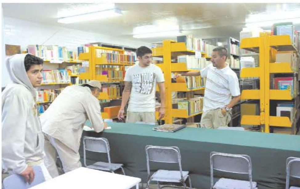
BIBLIOTECARIOS. Al menos cuatro personas se encargan de administrar la biblioteca del Reclusorio Norte, la cual abre todos los días

TEXTO GEOVANA ROYACELLI geovana.royacelli@eluniversal.com.mx • FOTOS JORGE SERRATOS