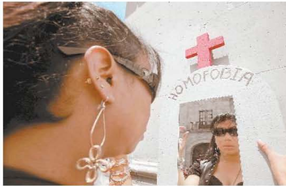
ESPEISMO. En Toluca, estado de México, integrantes de la comunidad lésbica gay se manifestaron frente a la sede del Congreso local para pedir a los diputados que se instale el Día contra la Homofobia.