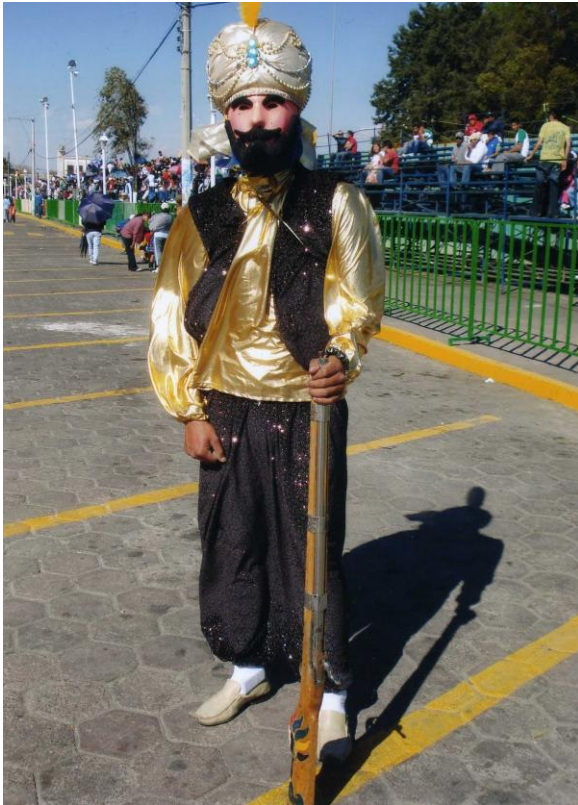
Foto 8. Casamiento Indígena