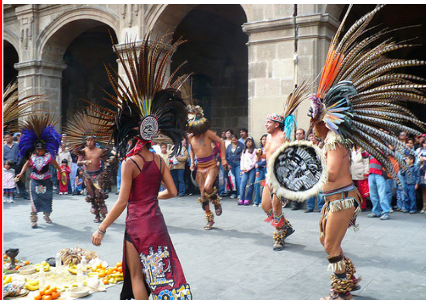
Danzantes zócalo capitalino.

un cliente real con un problema igualmente verdadero. Es notable como esta comunidad vino a nosotros para pedir y recibir el apoyo que necesitaban, y como se les brindó de una forma humilde y profesional, como es responsabilidad de cualquier estudiante o profesionista perteneciente a nuestra universidad.