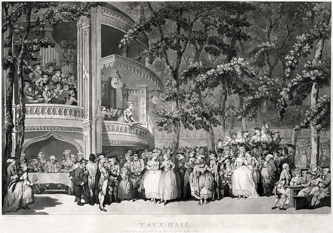
Los jardines de Vauxhall, Londres. Grabado de Thomas Rowlandson, 1785. 15

También es relevante el papel que juega el intérprete en este proceso, nuevo actor del panorama musical. Es en este momento que surge la figura divinizada del intérprete, claramente influida por los grandes virtuosos de la ópera. Este músico trabajará ya no para producir una obra para su patrón, sino para actuar un espectáculo que produce ganancias en dinero. El compositor permanece casi esclavizado a manos del patrón, que paga una sola vez por la obra compuesta, sin importar cuántas veces se represente ni cuántas ganancias genere; ése es el caso de muchos compositores de ópera desde el siglo XVII: