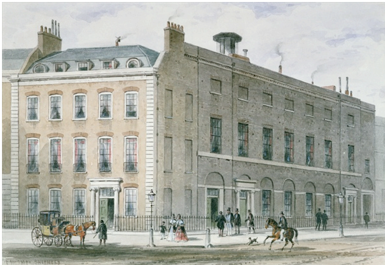
Las Hanover Square Rooms en Londres. Grabado de Thomas Hosmer Shepherd, c.1830. 39

Paganini, Berlioz, Liszt, Clara Schumann y otros 37 ), inaugurada en 1775 y marcando el clímax de su empresa. 38 Además, era una excelente forma de difusión de sus composiciones, pues en estos conciertos se tocaban las sinfonías, conciertos y demás obras vocales e instrumentales de los mismos Bach y Abel, además de otros compositores de moda.