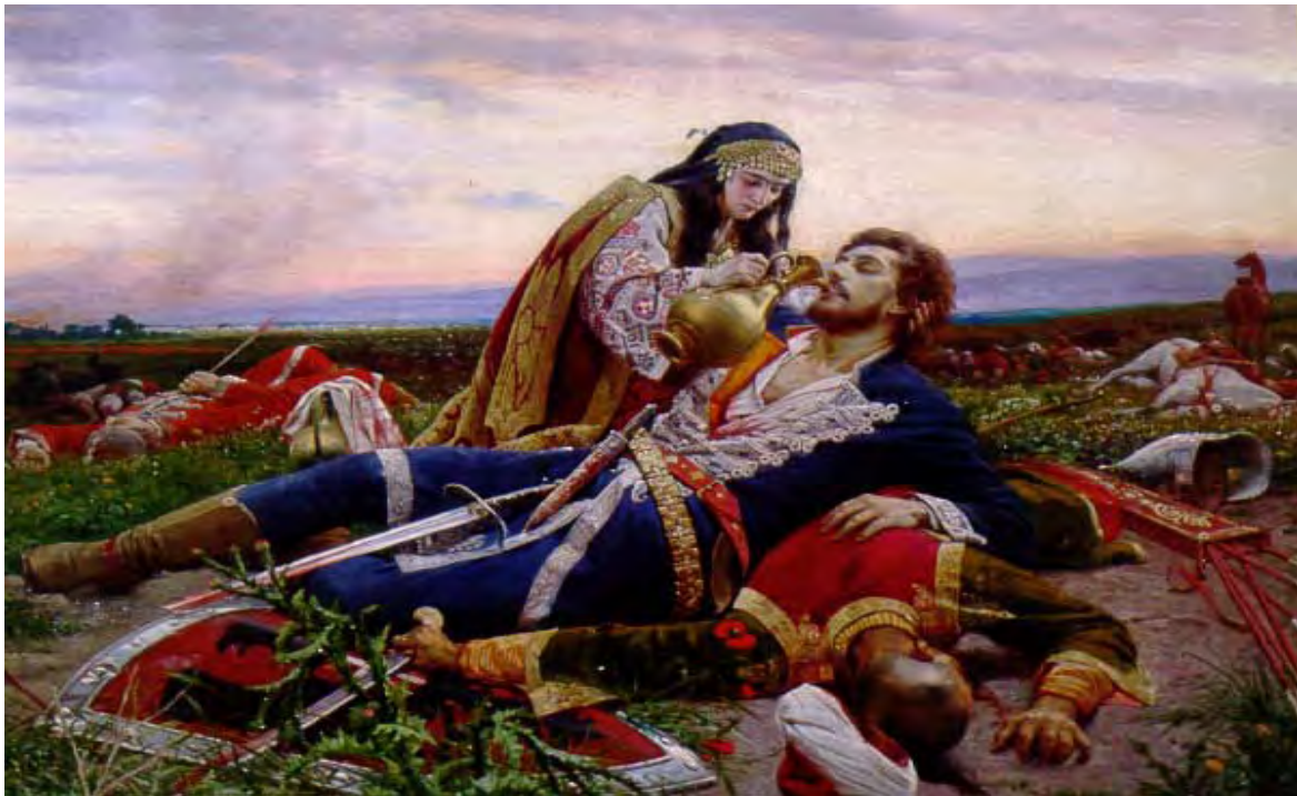
Momento en el que Lazar se sacrificó en la Batalla del Campo de los Mirlos

“Durante la larga lucha de los serbios por construir un Estado nacional contra el Imperio Otomano, iniciada en 1804, se fue tejiendo la leyenda, según la cual, en vísperas de la batalla de Kosovo Polje, un halcón voló desde Jerusalén hasta el cuartel general del Príncipe Lazar, llevando una alondra en el pico. El halcón era San Elías y la alondra era un mensaje enviado por la Virgen María. Horas antes de enfrentarse a las tropas turcas, Lazar era invitado por el Altísimo a elegir entre la victoria y el reino de este mundo o la derrota y la gloria de los cielos.” 29