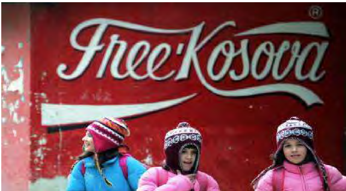
Imagen que simboliza el apoyo estadounidense a la comunidad albanesa.

Lo que nunca imaginaron los albanokosovares fue el hecho de que durante la administración de Bush iban a lograr su anhelada independencia. Los serbios de Estados Unidos llegaron a pedir incluso el voto para Bush, más cercano a sus intereses que el pro albanés Kerry.