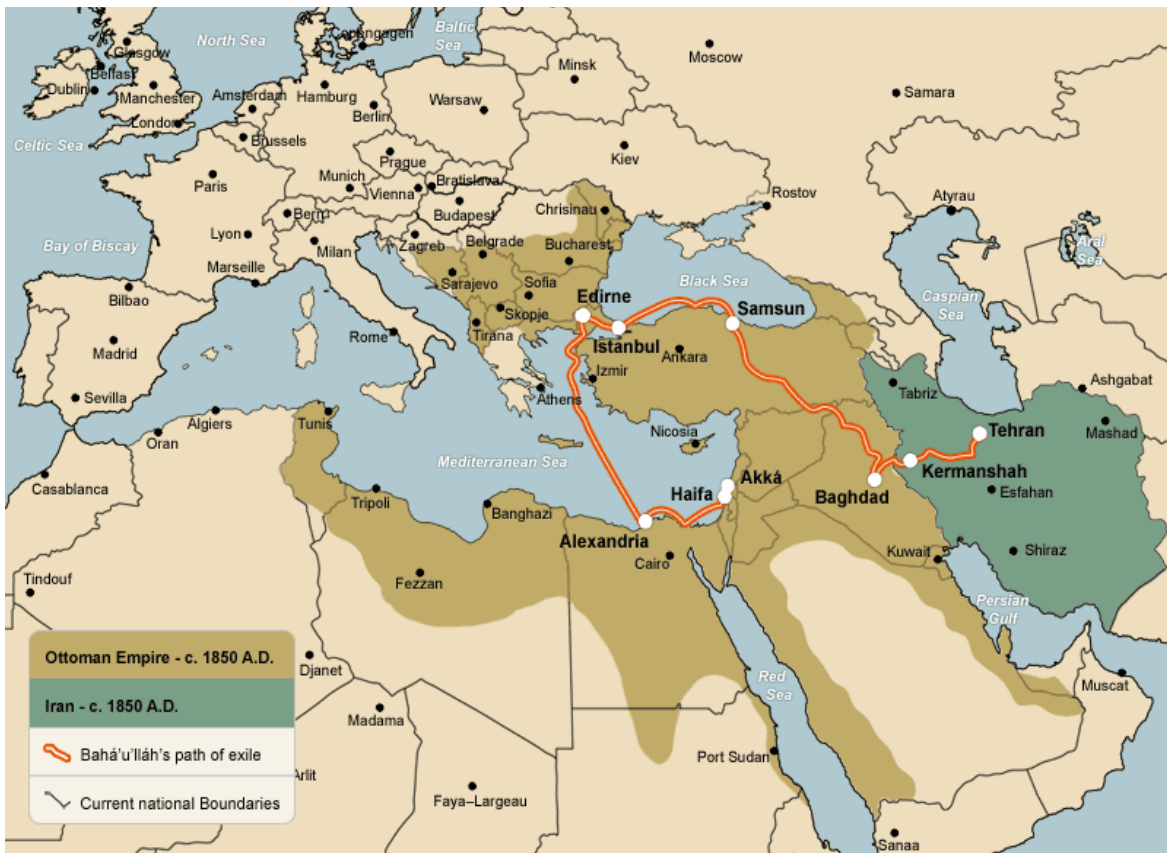
Alcance territorial del Imperio turco-otomano

Los albaneses que se movieron de los recientemente terrenos serbios liberados, contribuyeron a los cambios de la demografía de Kosovo. El serbio etnógrafo Niko Zupanic, meniona en su obra Les Origins des Serbs que 150.000 Serbios dejaron Kosovo entre 1876 y 1912.