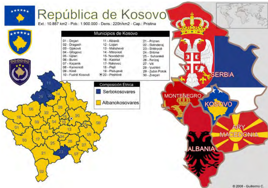
Distribución de los 30 municipios en Kosovo.

pusieron mucho empeño. Pero finalmente después de la independencia se quedaron los 30 municipios, existentes.