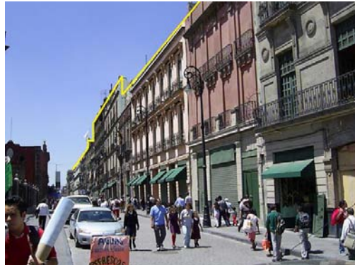
Art.4.2: proporciones, alturas, aspecto, alineamientos, etc.