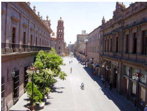
Art.4.10: Los colores y los acabados en fachadas.