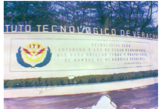
Instituto Tecnológico de Veracruz

Existe una paradoja en cuanto al desarrollo de la educación a distancia en Veracruz. El Instituto Tecnológico de Veracruz siendo la segunda casa de estudios más importante del estado, contrastante con la Universidad Veracruzana, no tiene ningún programa propio, ningún proyecto de