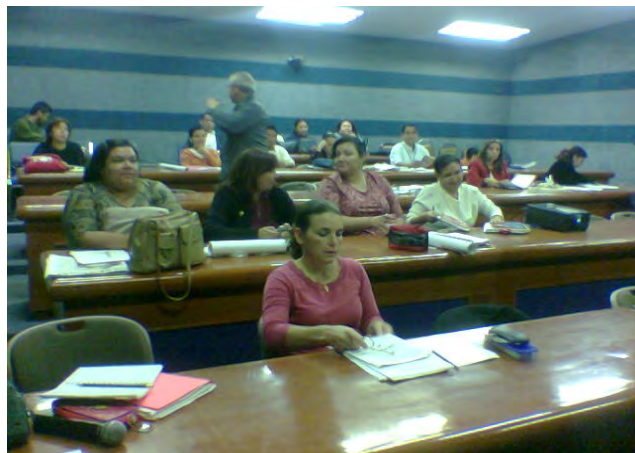
Videoconferencia impartida en La Universidad Veracruzana sede Boca del Río, Ver.

Los alumnos, en su mayoría adultos, siempre atentos a la maestra, la cual estaba impartiendo clase desde la ciudad de Xalapa. Hubo interacción y retroalimentación tanto con la maestra como con los alumnos de la sede Coatzacoalcos.