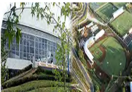
Universidad Veracruzana Campus Xalapa

En Veracruz, la Universidad Veracruzana (UV), es la institución que ha emprendido proyectos importantes en este campo de la educación. En 1994 surge el departamento de Educación a distancia de la UV con sede en Xalapa, ofreciendo maestrías,