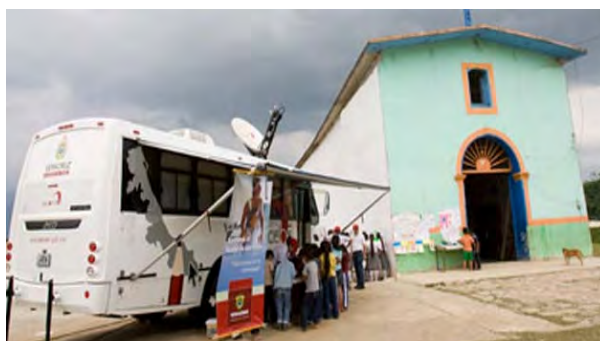
Autobús Vasconcelos en la sierra de Zongolica, Veracruz.

El gobierno de Veracruz, ha emprendido, siguiendo las demandas de educación de las comunidades marginadas y apoyándose en las nuevas tecnologías, el programa: Vehículos Autónomos de Soporte al Conocimiento y Liderazgo para la