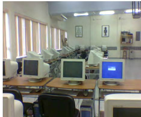
Aula Clavijero en el Centro Universitario Hispano Mexicano

En un principio el Consorcio Clavijero tuvo problemas con la plataforma utilizada, la cual era “eminus”, por lo que varios alumnos se dieron de baja, pues perdieron fe en el proyecto, después la plataforma, cambio a moodle, la cual es una herramienta, mas universal y fácil de utilizar y con la cual los alumnos y los profesores se sienten más cómodos.