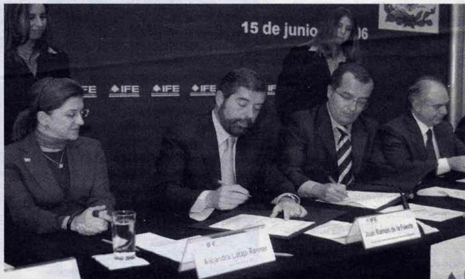
Durante la firma del convenio.

responsable de organizar y supervisar el proceso electoral.