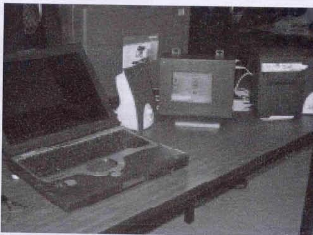
Para proporcionar confiabilidad y seguridad al sistema electrónico, los aragoneses desarrollaron un dispositivo de votos cifrados y bitácoras de la jornada electoral, además de un soporte físico de comprobantes de votación.

Uno de los requisitos que mayor énfasis puso el IEDF dentro de su convocatoria fue el de la confiabilidad y seguridad de la urna, de manera que los aragoneses trabajaron en un equipo que proporcionara las mayores certezas posibles: ocuparon un sistema operativo Linux que, de acuerdo con Jesús Hernández, es uno de los más seguros y estables a nivel mundial, de manera que los