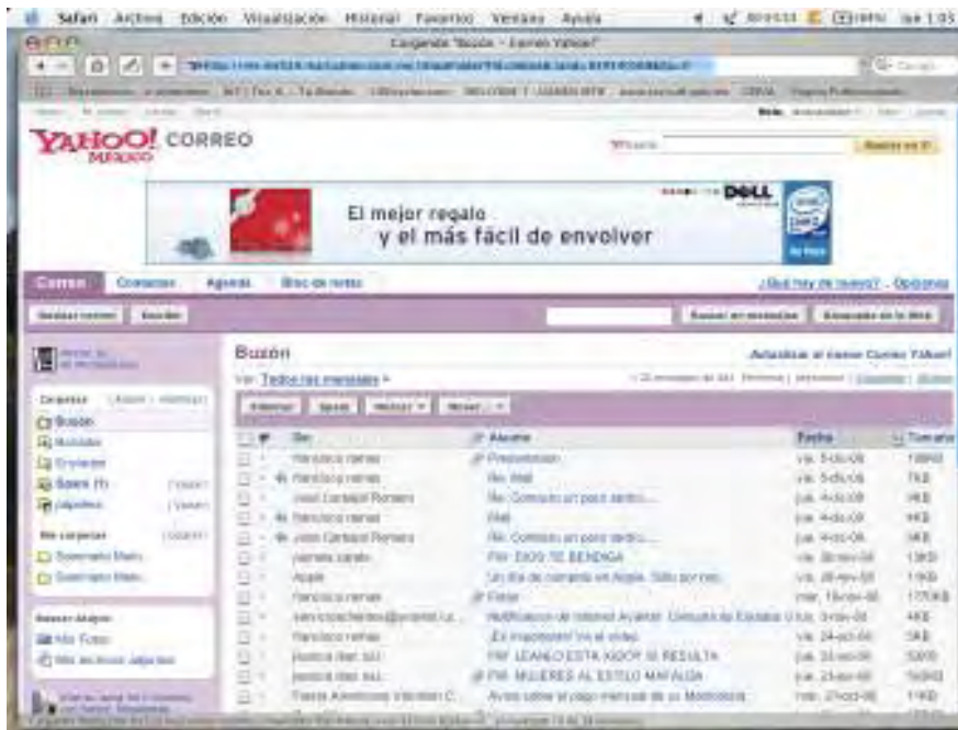
Formato de correo electrónico de Yahoo

de sistemas síncronos o asíncronos (según sea, o no, necesaria la coincidencia temporal entre el emisor y el receptor), de los que permiten la comunicación uno a uno, uno a muchos, muchos a muchos, y de los que emplean el lenguaje escrito o el lenguaje oral (acompañado o no por imágenes) durante la comunicación. La combinación de estas características dará lugar a una gran variedad de modalidades.