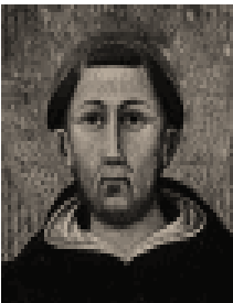
SANTO TOMAS DE AQUINO (1225-1274)

Nace en Roccasecca, en el pueblo de Aquino que está cerca de Nápoles. Perteneció a una noble familia napolitana. Estudia en la universidad de Nápoles y a los 20 años entra en la orden dominicana. Se gradúa en la universidad de París y da clases en ella. Estudia a Aristóteles, el cual significara mucho en su filosofía. Entre sus obras importantes podemos encontrar: Ente y esencia y la Summa Theologica .