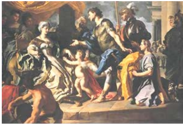
Figura 4: Francesco Solimena (1657-1747) Dido acoge a Cupido y a Eneas. (c. 1720) óleo sobre tela 207.2x310.2 cms. National Gallery, Londres.

Fuente: http://www.larevelacion.com/Mitologia/Imagenes/periplosII2.jpg 30 de enero del 2008.