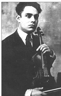
Figura 11: Silvestre Revueltas.

Nació el 31 de diciembre de 1899 en Santiago Papasquiaro, pequeña población en el estado de Durango. Inició sus estudios musicales y de violín en el año de 1906. Posteriormente, en 1913, en la ciudad de México, se inscribió en el Conservatorio Nacional de México, donde tuvo por maestro de violín a José Rocabruna y de composición al Mtro. Rafael J. Tello. Posteriormente en 1918, a los 19 años de edad se inscribió en el Chicago Musical College en el que tuvo como maestro de violín a Leon Sametini y de composición al Mtro. Félix Borovsky. Ahí recibió un diploma en graduación de violín, armonía y composición. En 1920, viajó a México por un corto período y volvió a Chicago a continuar sus estudios de violín con Vaslav Kochansky y con Otakar Sevcik.