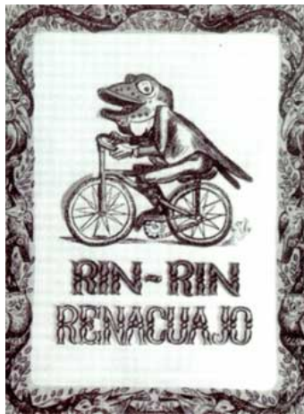
Figura 12: Portada de José Chávez Morado para “ El Renacuajo paseador ”, de Rafael Pombo.

Los tres últimos años de su vida los dedicó fundamentalmente a la composición logrando así algunas de sus obras más célebres tales como: “Sensemayá” (1938), “La noche de los mayas” (1939) y su última obra, el ballet “La coronela” que fue inspirado en los grabados de José Guadalupe Posada (1940). Ya en México, debido a un ataque de neumonía, Silvestre Revueltas falleció la noche del estreno de su ballet “ El renacuajo paseador ” el 5 de octubre de 1940.