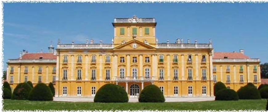
Figura 6: Palacio de Esterháza.

El Príncipe Paul Anton Esterházy había escuchado una de sus Sinfonías, lo que lo convenció para ofrecerle el trabajo de vicedirector de la Orquesta Princesca. Haydn firmó el contrato en 1761. De esta manera se unió por el resto de sus días con la familia Esterházy. A Paul Anton le sucedió su hermano Nikolaus, llamado Nikolaus “el magnífico”, al que Haydn sirvió durante 28 años. El castillo de Eisenstadt pronto fue insuficiente para el Príncipe Nikolaus, por lo que mandó construir un gran palacio en un extremo del lago Neusiedl. Este palacio fue llamado Esterháza donde Haydn y sus músicos se instalarían definitivamente hacia el año de 1768.