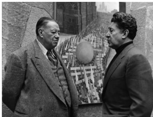
Figura 10: Diego Rivera y David Alfaro Siqueiros.

Las grandes transformaciones políticas de la Revolución Mexicana afectaron la vida musical del país. Un ejemplo de ello es Manuel M. Ponce, quien emigró en 1915. El Conservatorio Nacional de México era cuestionado por su escasa producción artística y eran constantes los cambios en su dirección y en la de su orquesta, eventos que respondían principalmente a factores políticos. El movimiento cultural derivado de la Revolución Mexicana de 1910 y dedicado a recuperar las raíces nacionales involucró a artistas e intelectuales como David Alfaro Siqueiros, Diego Rivera, José Clemente Orozco, José Vasconcelos entre otros.