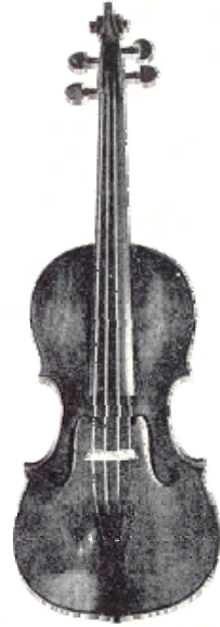
Figura 2: Violín de Tartini Guarnieri di Gesu de 1708.