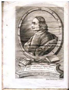
Figura 1: Giuseppe Tartini

De carácter apasionado y rebelde; desde su juventud se opuso a los deseos y caprichos de su familia. Se negó a ser sacerdote franciscano y el 29 de julio de 1710 a la edad de 18 años, se casó con Elisabetta Premazore, sobrina del cardenal Giorgio Cornaro, obispo de Padua. La pareja mantuvo su matrimonio en secreto durante 3 años hasta que fueron descubiertos; Tartini fue acusado por el delito de secuestro, siendo arrestado y obligado por orden del obispo a dejar Padua. Su mujer fue enviada a un convento.