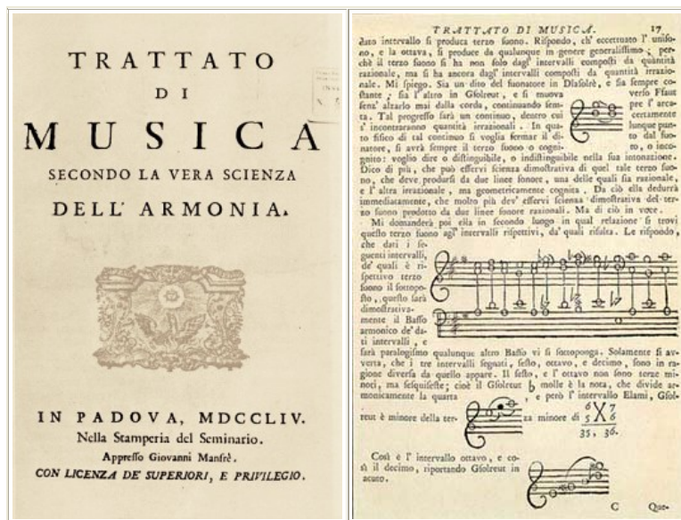
Figura 3: Trattato di musica secondo la vera scienza dell' armonia.

Trattato di musica secondo la vera scienza dell' armonia (Padua,1754); De' principi dell'armonia musicale contenuta nel diatonico genere , terminado en 1764 y publicado en Padua en el año de 1767; sobre las formas de adornar en la música, material que fue publicado después de su muerte como Traite des agrements (Paris, 1771); sobre técnica del arco para lograr cantar con el violín Regole, ed esempi necessari per ben suonare (Paris, 1771); entre otros.