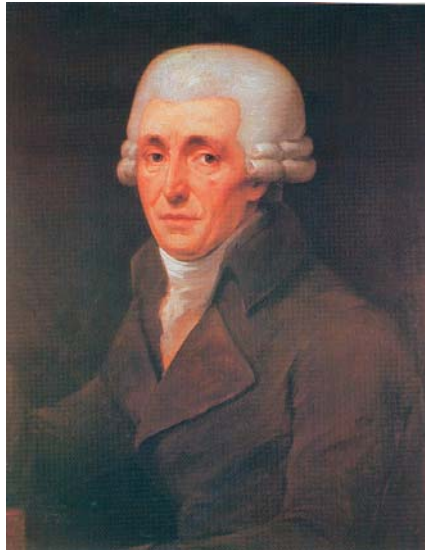
Figura 5: F. J. Haydn.