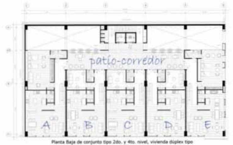
Planta Baja de conjunto tipo 2do. y 4to. nivel, vivienda dúplex tipo