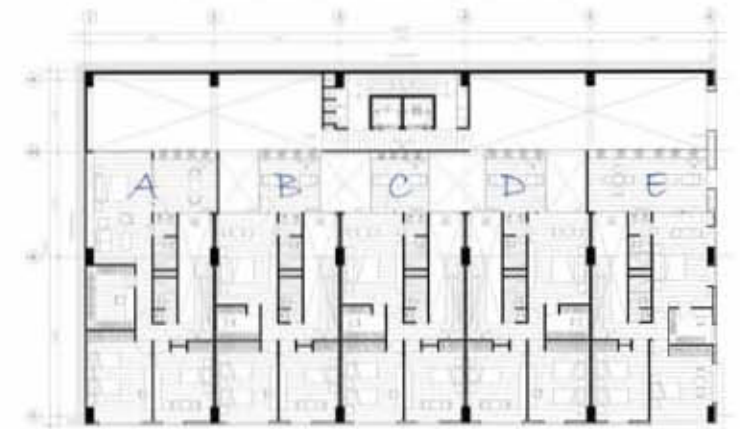
Planta alta de conjunto 3er. y 5to. nivel, vivienda dúplex tipo