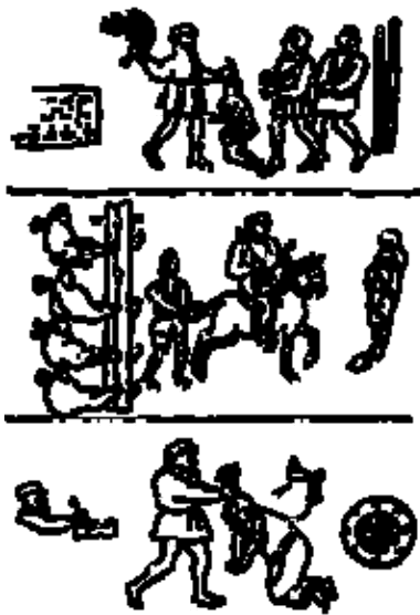
La suerte de los vencidos (Quejas contra el corregidor Magariño. Archivo de Indias)

La tradición oral como recurso didáctico en la educación de los nahuas les permitió conservar su historia, educarse en los principios y normas establecidas por su sociedad, pero si recurrimos a los cantos en el presente la intención cambia, pues estos son textos que además de tener que traducirlos (nahuatl-español), habrá la necesidad de interpretarlos (comprenderlos) de tal forma que en estos se podrán conservar textos históricos cuya visión partirá de los vencidos, los oprimidos. De tal forma que al recuperar los cantares como recursos didácticos, es dar voz a aquella sociedad que no se le permitió manifestar sus pensamientos y sus creencias, si bien los cantares son considerados expresiones artísticas, también es cierto que son fuente de información y que al poder estudiarla puede permitirnos formarnos un mejor criterio y conocimiento.