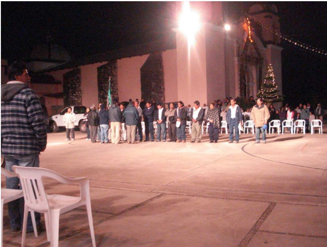
Aidé Jiménez, “Cambio de Autoridad”, San Miguel Cajonos, Oaxaca, diciembre de 2009. Técnica digital.

Cada año, el último día de diciembre, en San Miguel Cajonos cambian representantes. Efectuándose por este motivo ceremonias de carácter político y religioso. Llegando precisamente la media noche, públicamente se procede a la entrega de mando, con algunas palabras textuales que expresa el secretario municipal tomando la protesta a los elementos que fungirán como directrices el próximo año. Por la madrugada del primer día del año, el cuerpo de Autoridades encabezándolo el Agente Municipal y el Consejo de Ancianos se trasladan al atrio de la iglesia, donde toman la palabra los ancianos caracterizados para expresar parabienes y bienestares a los nuevos representantes del poblado, procediendo a entrar al templo.