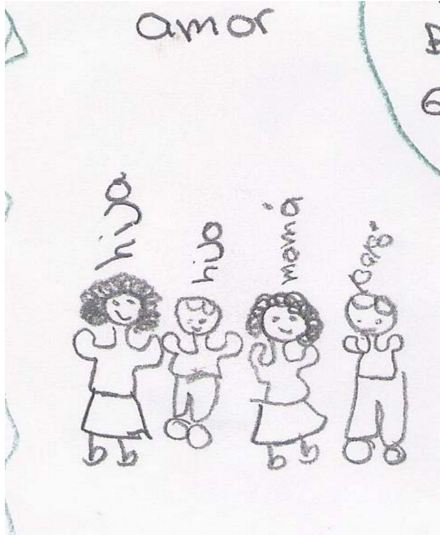
Dibujos realizados por Mi y Ca.