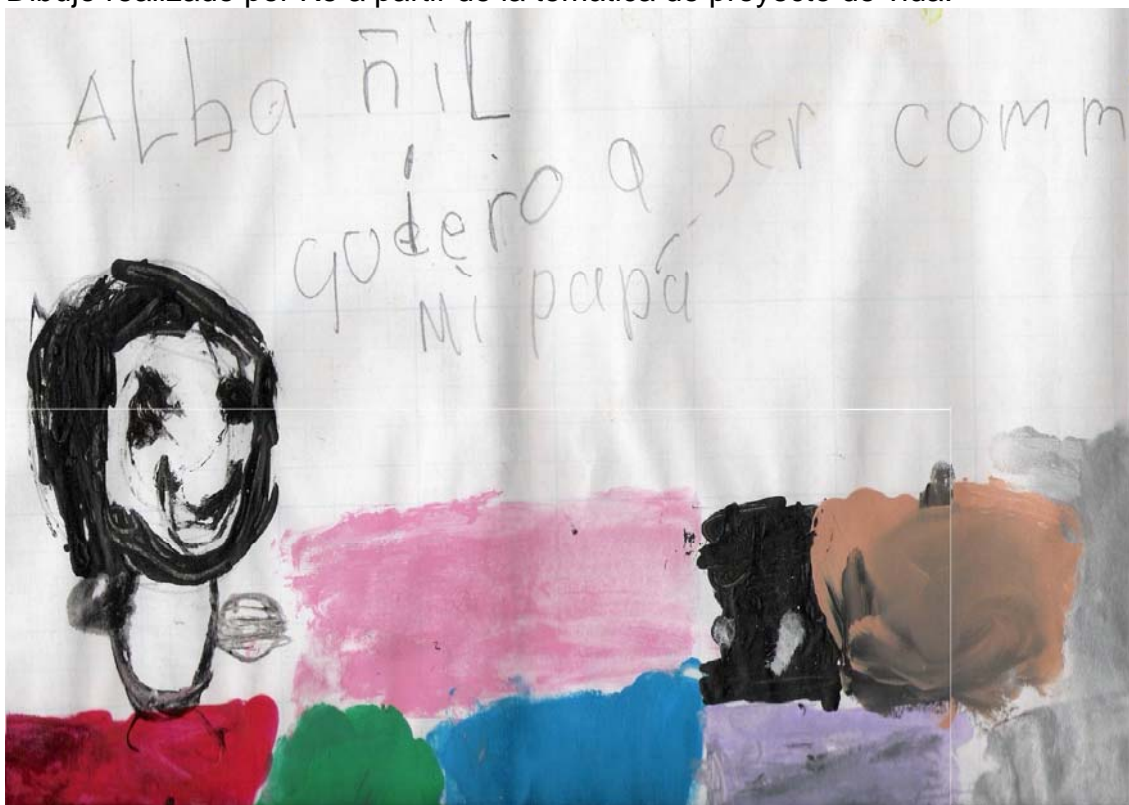
Dibujo realizado por Je a partir de la temática de proyecto de vida.