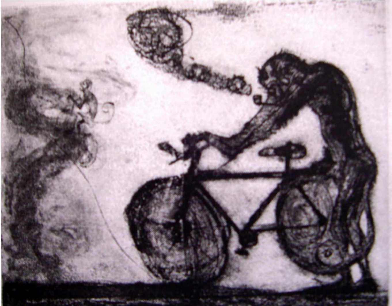
“Chango en bicicleta”, Aguafuerte, 39 x 49 cm., 62 x 69.5 cm., 2004