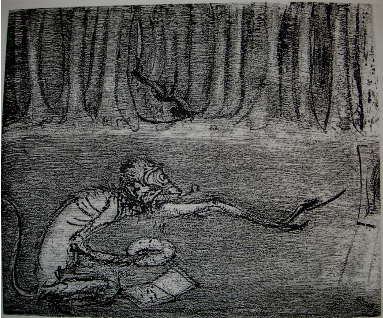
“...alcancé la cultura media de un europeo...”, Punta seca, 24.5 x 29.5 cm., 27 x 107 cm., 2004.