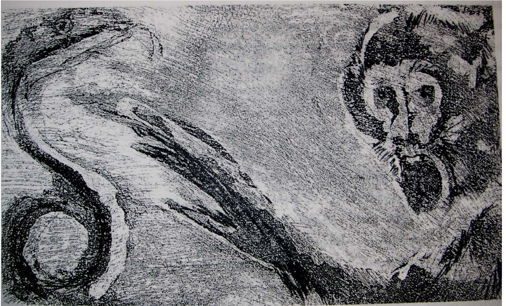
“...como las gigantescas serpientes que estaban justo frente a mí; exhalando el ultimo suspiro en su abrazo...”, Aguafuerte, 14.5 x 24.5 cm., 27 x107 cm., 2004