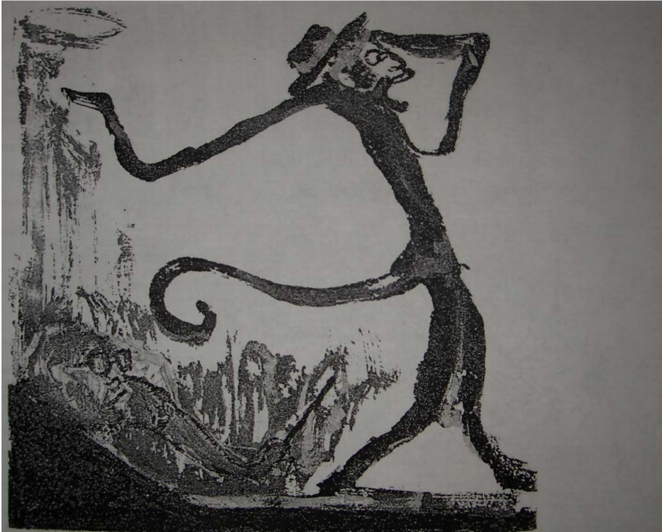
¡Estos progresos! ¡Esta irrupción de los rayos del saber desde todos los lados...”, Aguatinta al azúcar, 19.5 x 19.5 cm., 27 x 107 cm., 2004