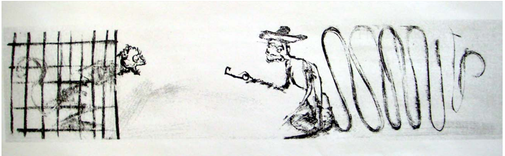
“una salida...” Aguatinta al azúcar, 21.5 x 98.5 cm. 27 x 107 cm., 2004

Kafka y Toledo asumiendo su obra como reflejo de su situación existencial analizan al poder desde el punto de vista de los grupos subalternos. Para ellos el mundo parece ser una entidad que les compele a alimentar una relación ambivalente, tornándose una imagen híbrida de ficción y realidad. Ambos, Kafka y Toledo, hacen, cada uno por su parte y desde sus circunstancias, uso de la alternativa del lenguaje para lograr, a través de sus obras, la reunificación de mundos “distantes”, el de los animales y el de los humanos, el de los “salvajes” y los “civilizados”, el de la imagen y el del texto, el de los mitos y el de las realidades, el de un checo y un juchitéco. Alcanzan una fusión de horizontes, 21 lograda a partir de la experiencia compartida de la bifrontalidad cultural creada por la situación existencial de su autor.