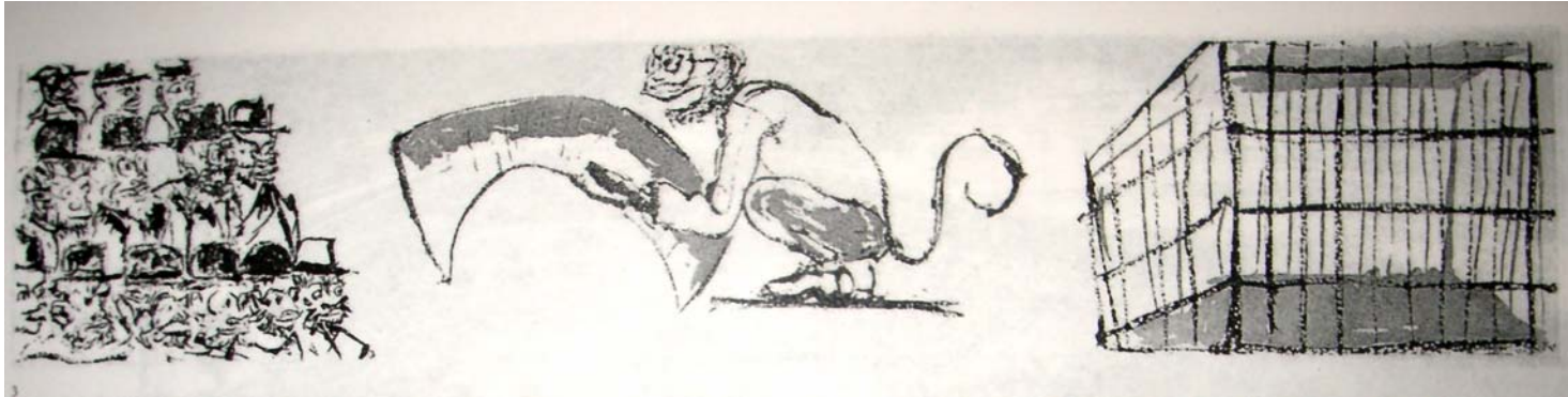
“hablando con franqueza: la simiedad de ustedes, señores míos...” Punta seca/ Aguatinta al azúcar 9x9 cm. 21.4 x 98.5 cm., 2004

Pareciera entonces que en la Punta seca mostrada arriba se expone, a partir de una concepción simbólica, la idea de la transformación humana, misma que permite abandonar la condición animal, que al mismo tiempo delimita la dicotomía salvaje-civilizado. ¿A caso es la identidad humana “civilizada” la que se problematiza en el marco del grabado?, y en su caso ¿es esto lo que permite en la serie de Francisco Toledo exponer una reflexión que tiene la intención de develar una situación existencial condicionada por su ámbito cultural? En el pie de imagen es posible identificar un texto que evoca a la permanencia de un rasgo animal en todo ser humano, incluso después de haber superado la línea evolutiva que dio pauta para emergencia del homo sapiens ; ejemplificada en este caso con un grupo de personas que parecen representar al sector “más civilizado” de la cultura europea, la Academia. De ahí la pregunta ¿es el vínculo indisoluble entre la condición animal y la humana lo que permite sustentar la problemática de la identidad, misma que parece ser un tópico recurrente en la obra de Toledo?