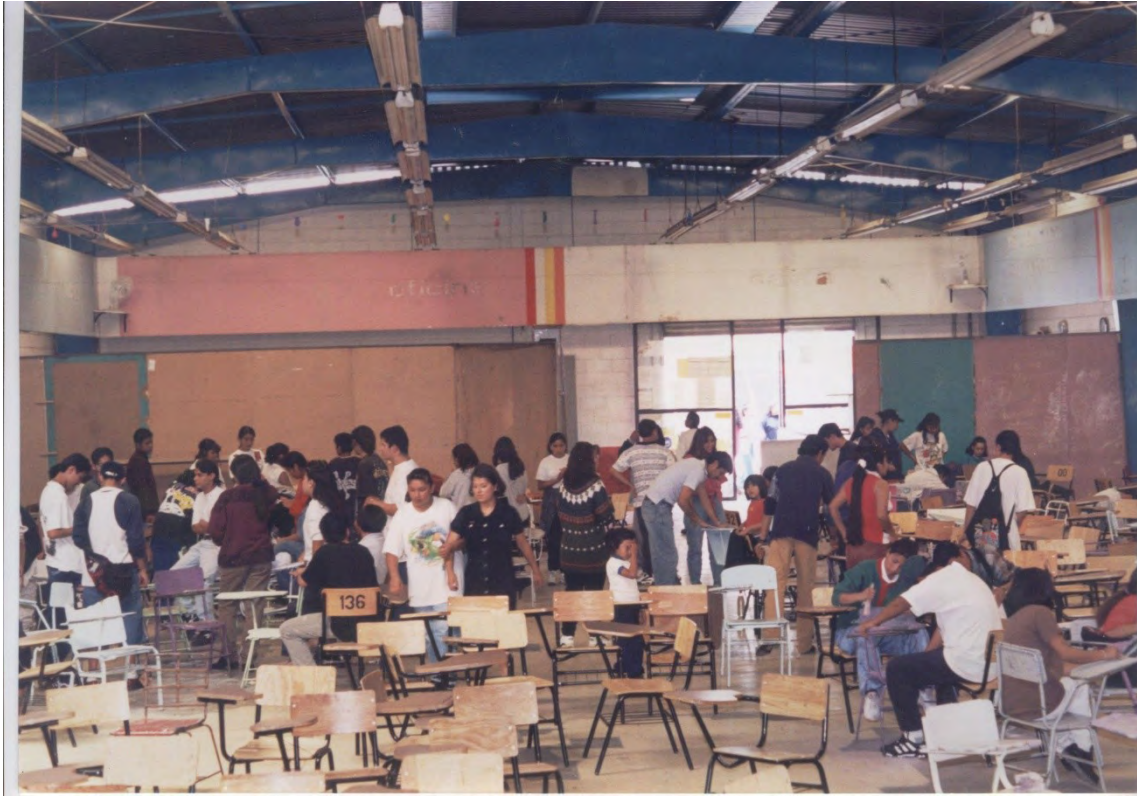
25.- Reparación de butacas, dirigida por los docentes