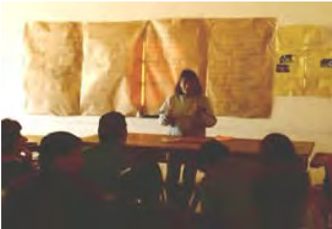
8. Cursos-taller en las instalaciones de la Escuela Preparatoria Forjadores de la Patria en Nezahualcòyotl.