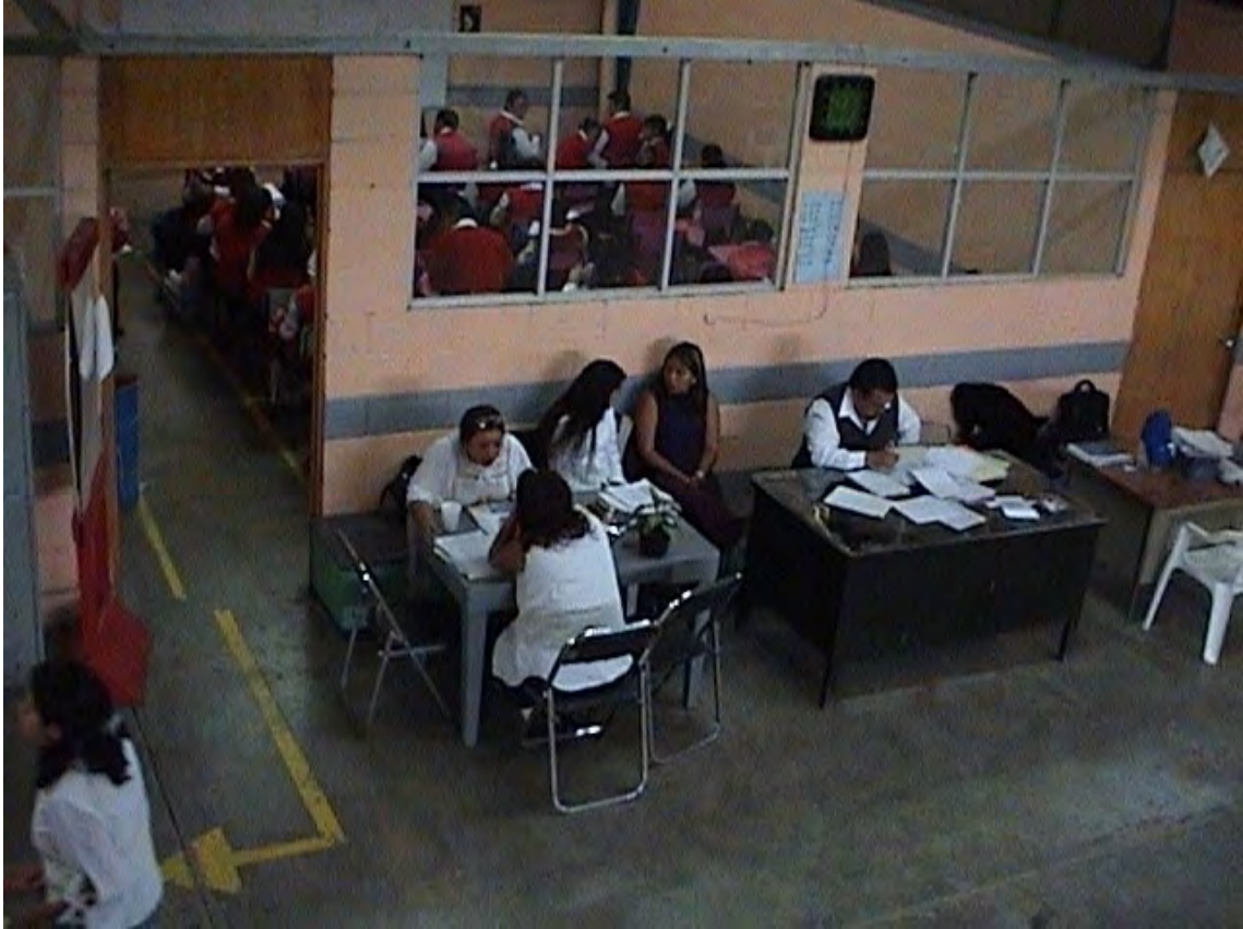
24.- El espacio destinado a Orientación educativa en la Escuela Incorporada 74