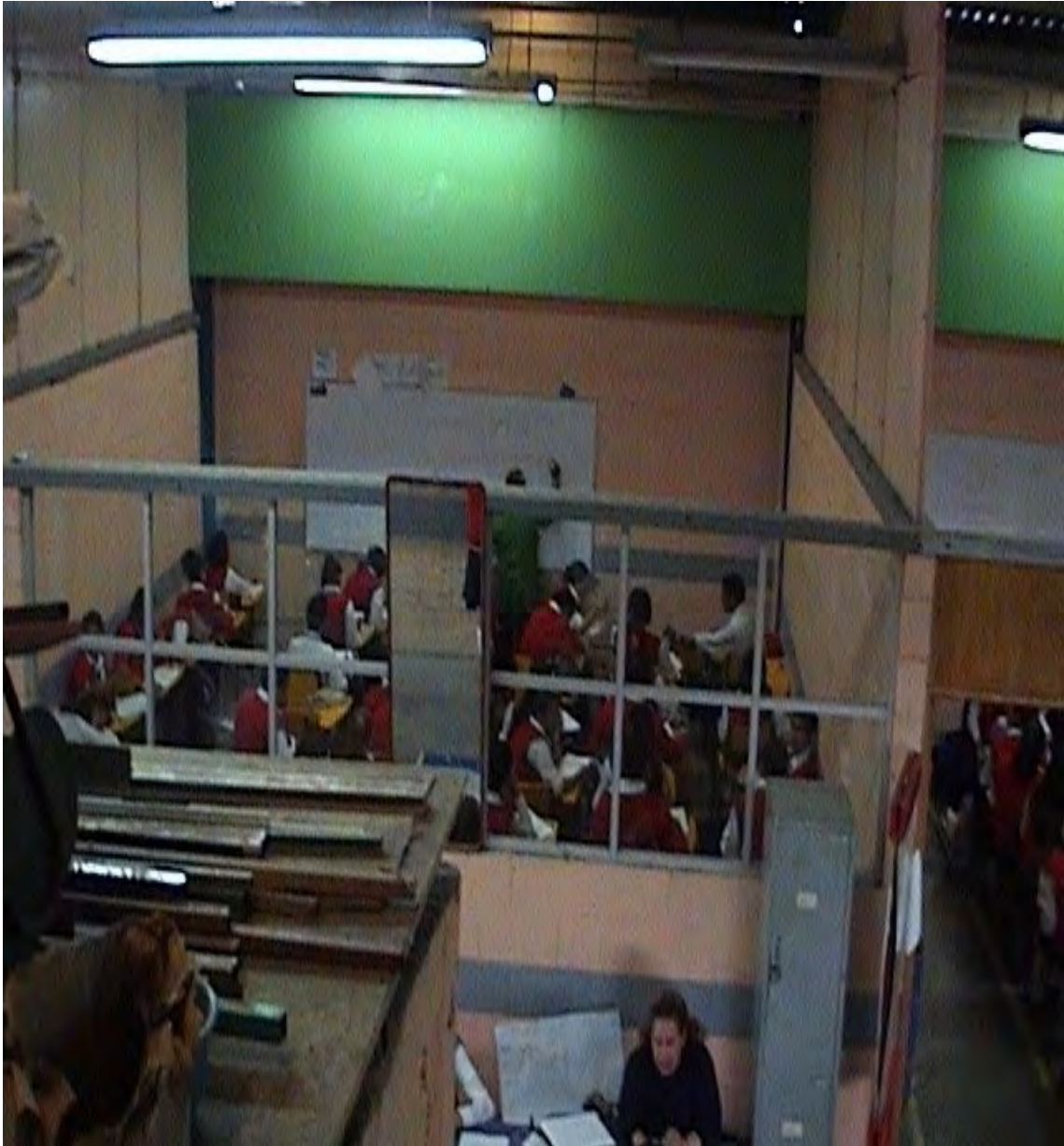
11.- Vista parcial de las instalaciones en la Escuela Preparatoria Incorporada Número 74