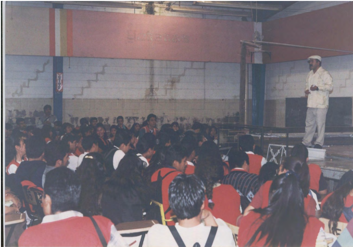
22.- Nuestro Director General dando un mensaje a los alumnos. En la bodega de la Ex CONASUPO