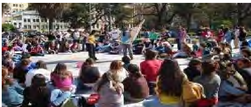
3.-Marcha hacia Gobernación en defensa de la educación pública