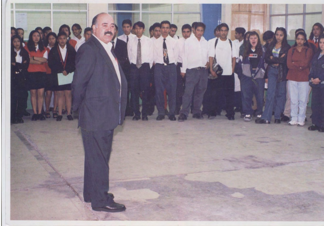
21.- Nuestro líder moral y director general de las Escuelas Preparatorias " Forjadores de la Patria.