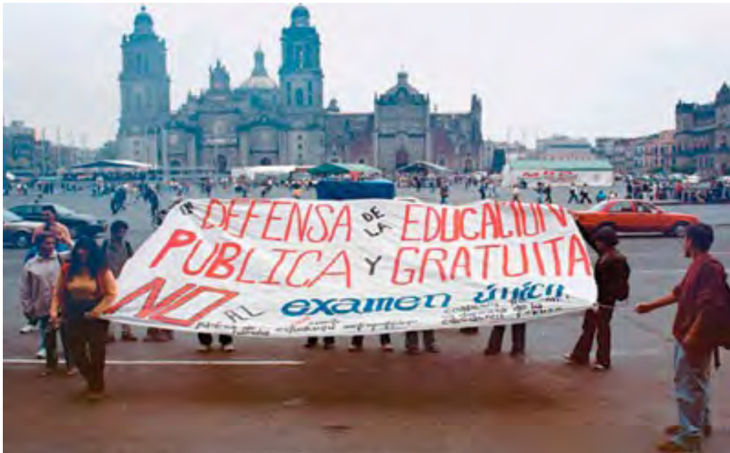
6.- Marcha –mitin de la comunidad Forjadores de la patria en el Zócalo de la Cd. de México en el año de 2005