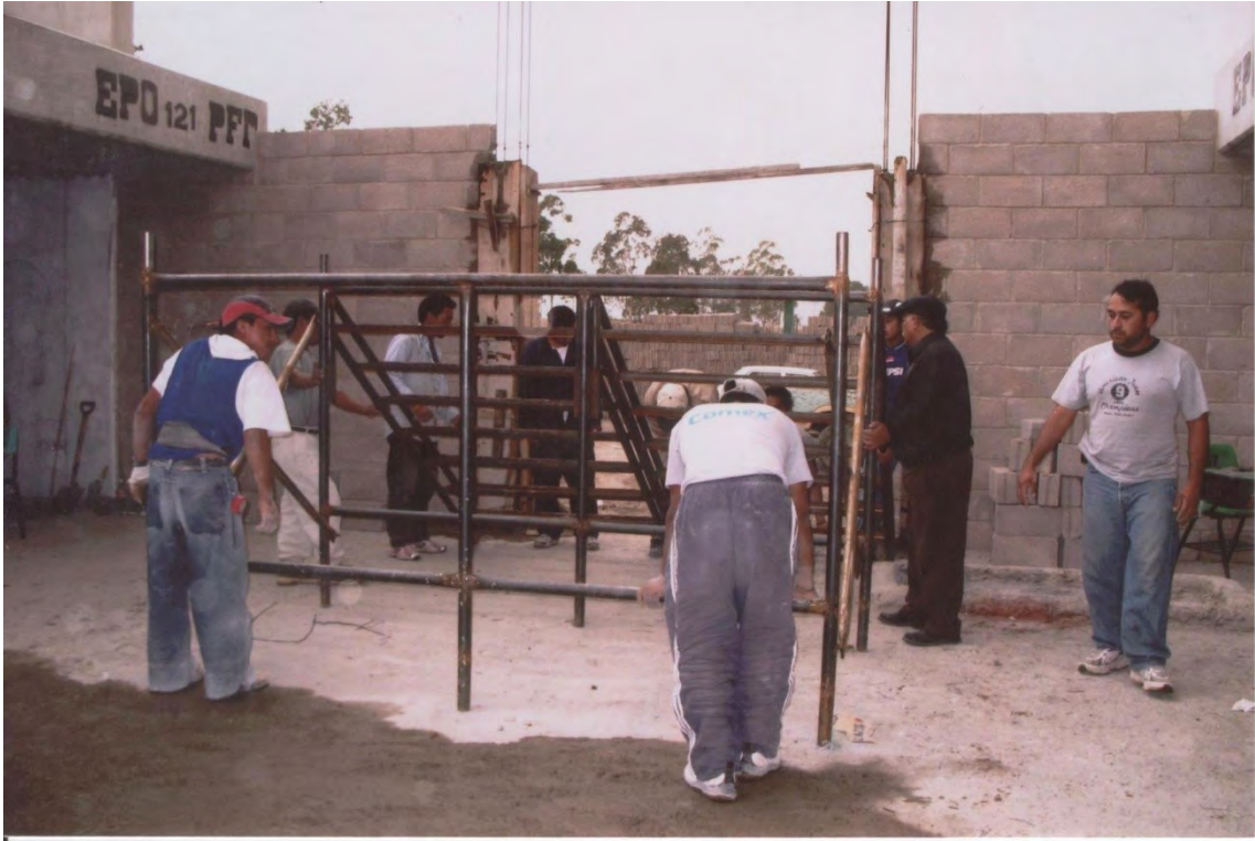
12.- compañeros maestros, padres de familia, alumnos y exalumnos colaborando en la construcción de la escuela