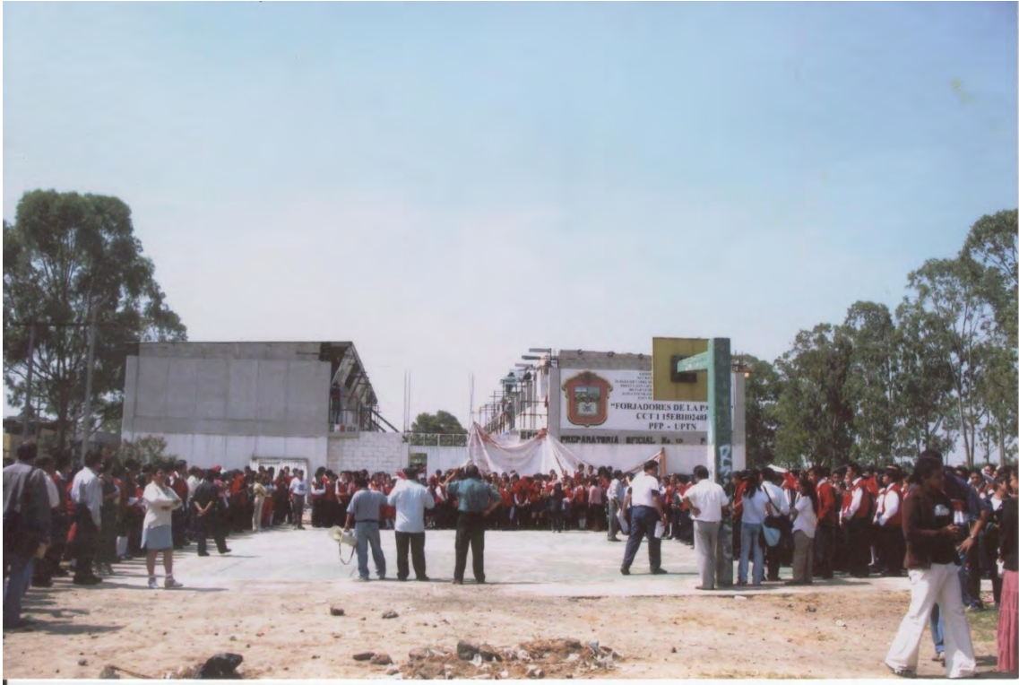
9.- En la ceremonia de inauguración de las nuevas instalaciones