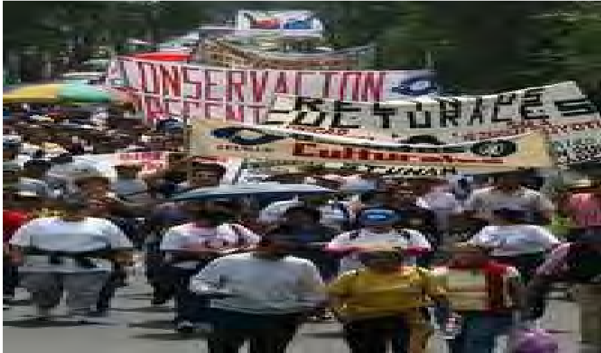
5.- Marcha por la defensa de la educación pública en el 2004.