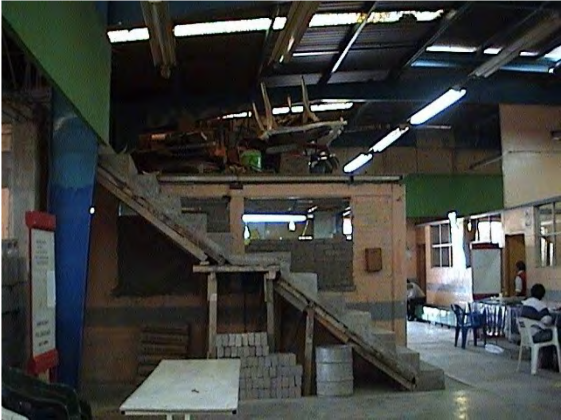
17.- Proceso de remodelación de la escuela preparatoria incorporada 174 con los recursos aportados por la comunidad.