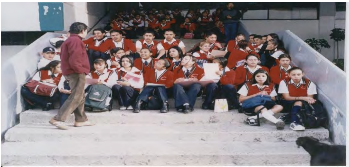
10.- Decididos a tomar clases en la escalera que da a la puerta principal del Palacio Municipal