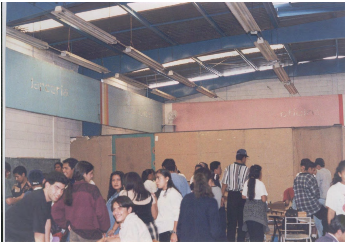
19.- Alumnos maestros y padres de familia de la primera generación, haciendo reparaciones a las instalaciones y mobiliario.