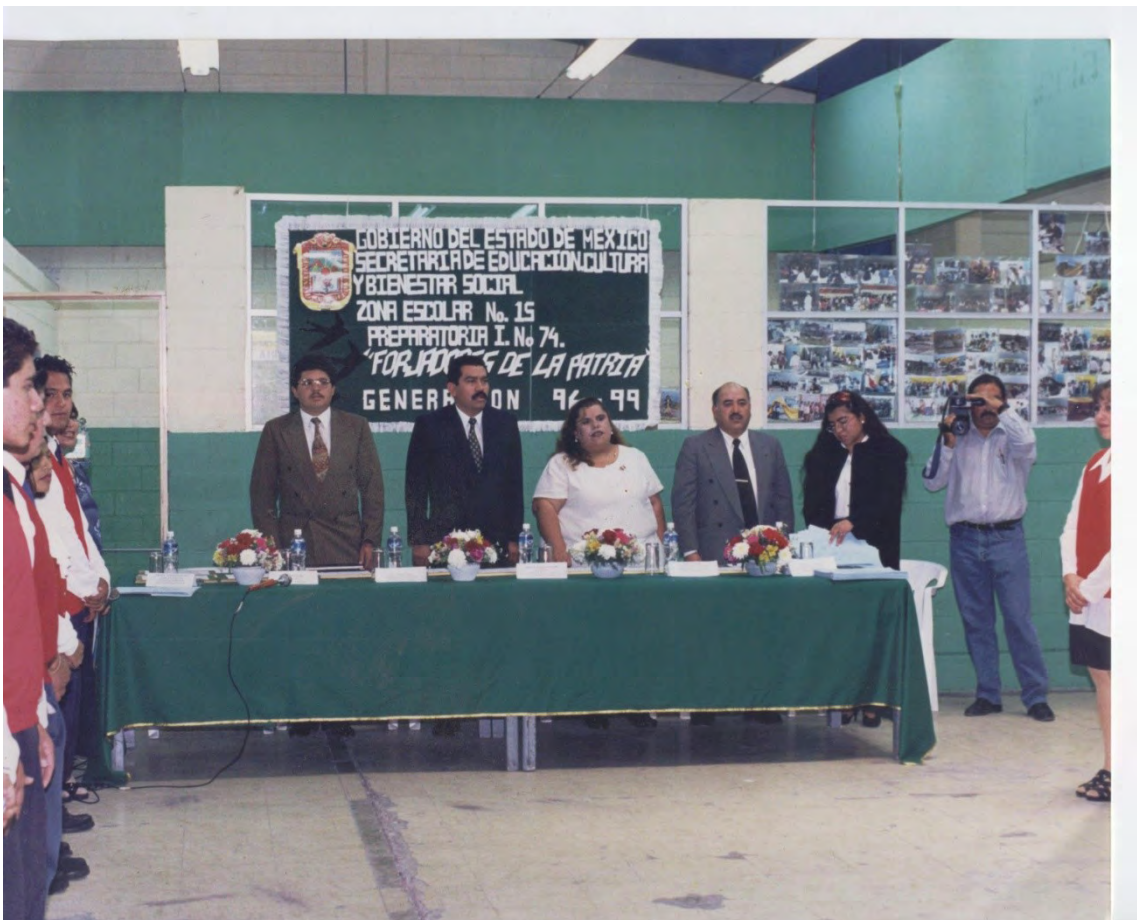
13.- en la ceremonia de egresión de nuestra primera generación.