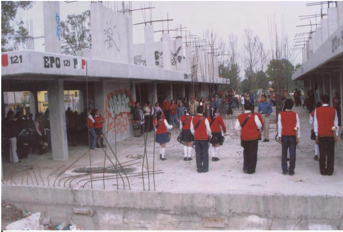
20.- Festejando con la comunidad escolar la toma de predio para la preparatoria oficial