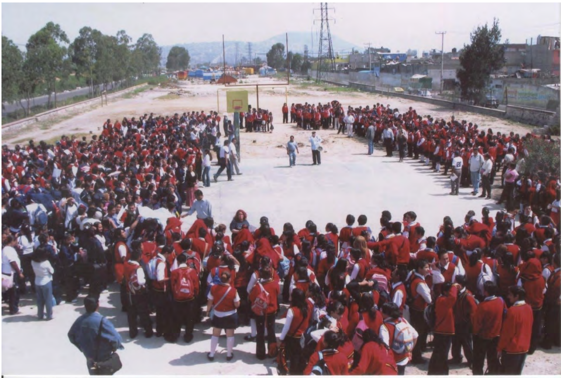
23.- Alumnos y maestros haciendo uso del nuevo espacio, que alberga ahora a la EPO 121.