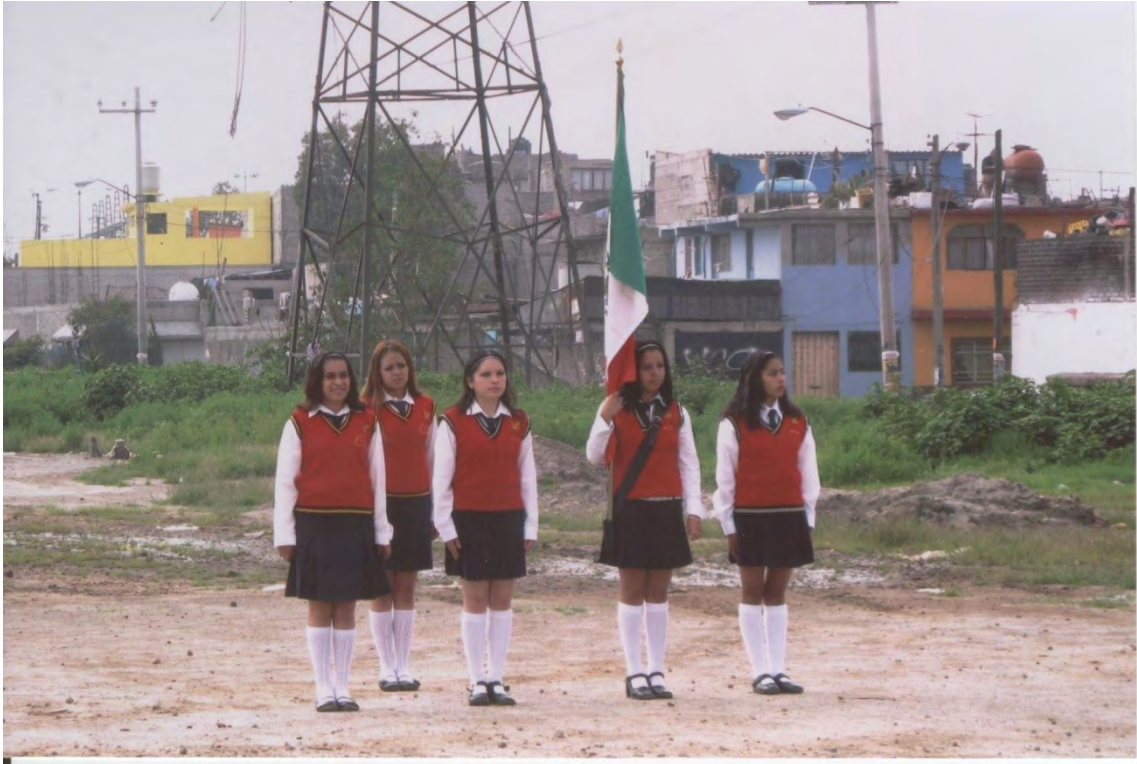
18.- Escolta de Forjadores de la Patria , en las nuevas instalaciones de la EPO 121