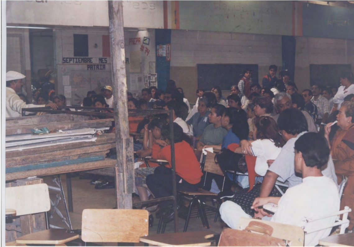
14.- reunión con padres de familia para organizar las estrategias de acción