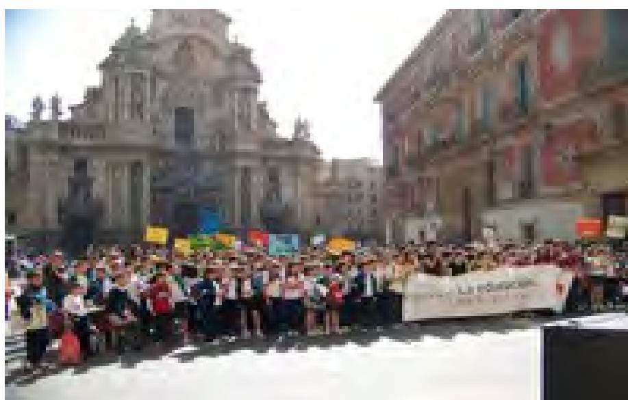
4.-. Marcha exigiendo instalaciones dignas para la educación