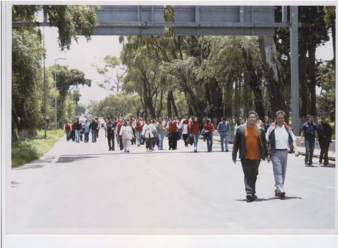
16.-Marcha a Toluca, por el Paseo Tollocan, ante el impedimento de dejarnos llegar con los camiones a la Ciudad de Toluca, para demandar al Gobernador instalaciones más dignas y la paga de los profesores.