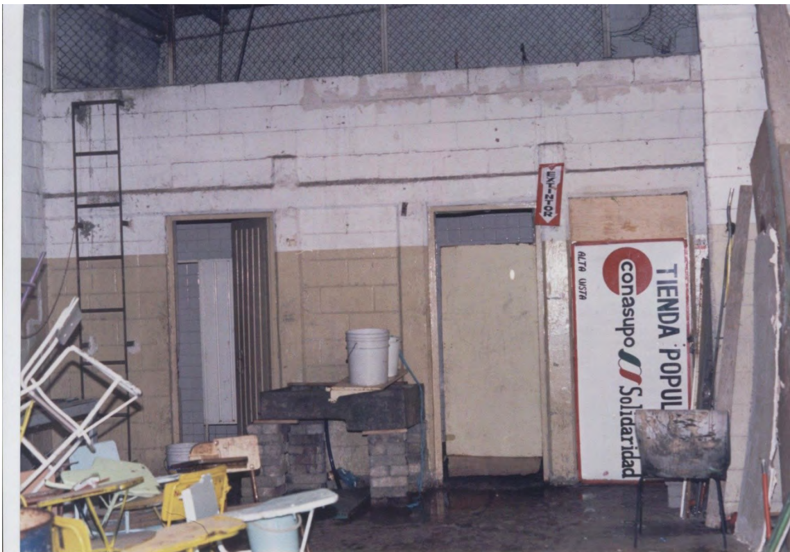
15.- Sanitarios y bodega de la Preparatoria 74 en el año 1999