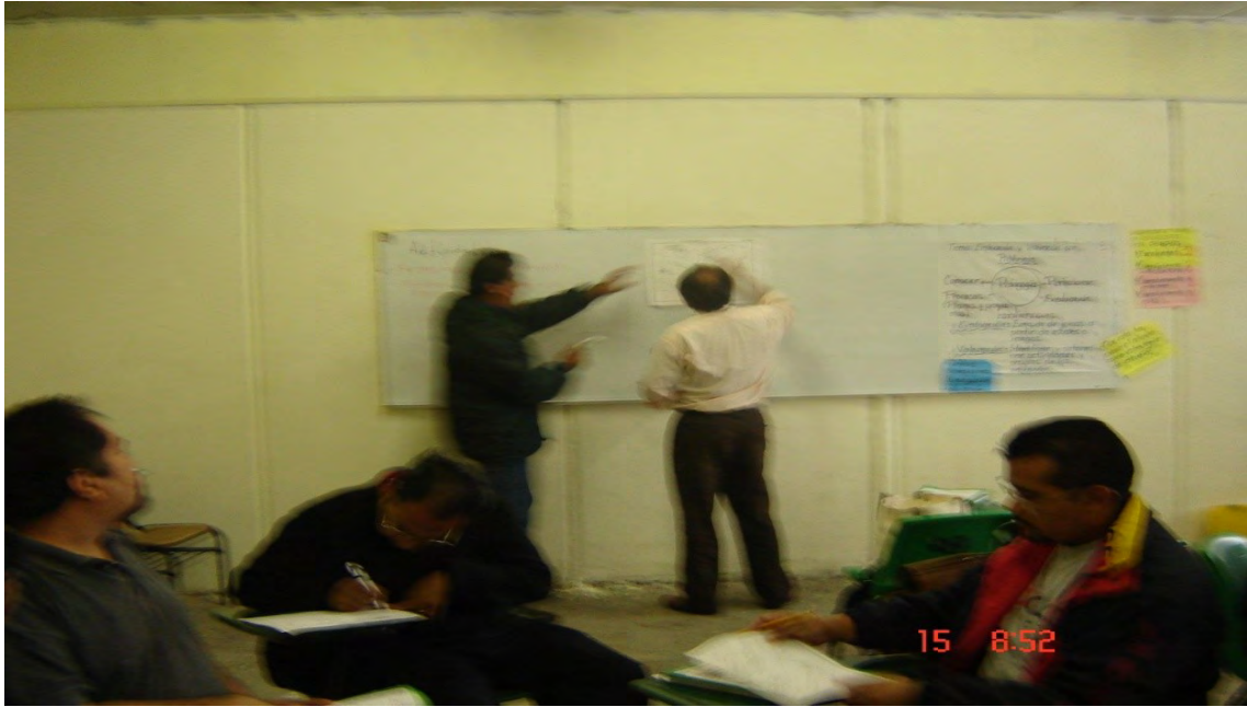
7.-Impartición de cursos-taller en la Escuela Preparatoria Oficial 121 "Forjadores de la Patria"