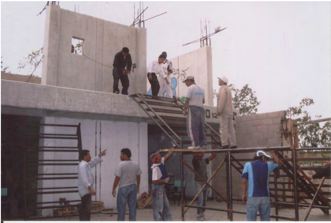
26.- Construcción de las aulas en la E.P.O 121 , dirigida por maestros, con la colaboración de alumnos , ex alumnos y maestros.