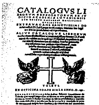
Índice de Lovaina

Las primeras guías sistemáticas de libros prohibidos que se emitieron en forma de índices, fueron publicadas en 1542 por la Universidad de París, en 1546 por la Universidad de Lovaina y en la década de 1540 en Italia.