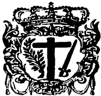
Escudo de la Inquisición

En el pontificado de Gregorio IX (1227-1241) surge la Inquisición como una institución, cuyo objetivo principal era erradicar la herejía que se había suscitado en el sur de Francia con los albigenses. Con ellos, el Papa redujo la responsabilidad de los obispos en materia de ortodoxia, sometió a los inquisidores bajo la jurisdicción del pontificado, y estableció severos castigos. El cargo de inquisidor fue confiado casi en exclusiva a los franciscanos y a los dominicos, debido a su mejor preparación teológica.