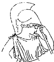
FACULTAD DE FILOSOFÍA Y LETRAS