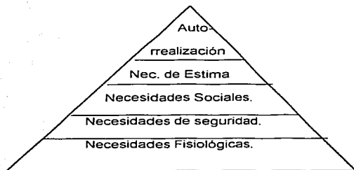
Pirámide de las necesidades del hombre propuestas por Maslow.